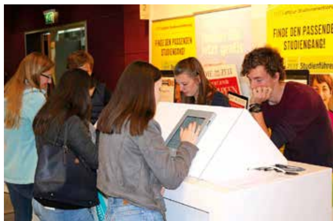
Impressionen Messe HORIZON