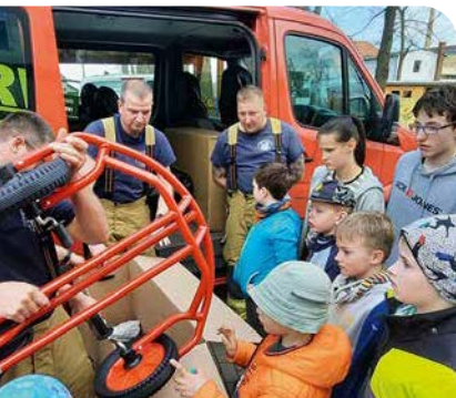
Feuerwehrlöcher sorgt für Riesen-Überraschung > Seite 7