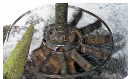
Das Mühlrad einer Flussmühle, klein aber effektiv.

wird die Kraft nach oben in das Haus auf den Mühlstein übertragen. Man braucht kein Getriebe. Der Zuflusstrog kann ab-schiebert werden, damit wird der Wasserzufluss auch reguliert, dementsprechend schnell ist die Umdrehungszahl der Wasserräder bzw. vom Mühlstein. Als man mich sah, hat man mich rein gewunken – meine Augen glänzten, hier wird Korn zu Mehl gemahlen, die Mühle arbeitet. Wie immer Staub und Spinnweben, drei Mühlsteine drehen sich. Oben rutscht aus den jeweiligen Trichtern Getreide in die Mühle. Unterhalb vom Mühlstein rieselt jungfräuliches Mehl in die Tröge. Ich kaufe für meine Frau zwei Tüten, dass eine ist Maismehl, dass andere muss ich noch erkunden. Bestaune wie in jeder Mühle die gesamte Ausstattung, Bilder, Urkunden und Genehmigungen der Behörden. Ich kann zwar gut kyrillisch lesen, doch diese Vokabeln habe ich im Militärrussisch nicht gelernt – kommt Zeit, kommt Rat. Ich werde immer neugieriger und will die Mühle von unten erkunden, doch der Bach führt gut Wasser. Ich gehe zum Auto und hole die Gummistiefel, diese habe ich auf meinen Reisen immer dabei. Ziehe mich bis auf den Schlüpfel und das T-Shirt aus, trenne mich sogar von meinem Kopftuch und steige in den Bach. Vorsichtig gehe ich durch das Bachbett unter das Mühlenhaus, es wäre ungünstig im Wasser mit den zwei Fotoapparaten zu stürzen. Ganz nah sehe ich nun wie sich die Wasserräder