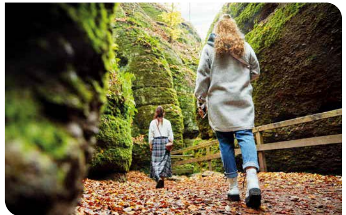
Zecken können draußen im Grünen auf bodennaher Vegetation, wie Gräsern und Büschen, lauern.