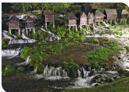
Die Flussmühlen in Jajce sind schon beeindruckend.