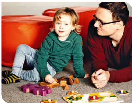
Kinderspielzeug sollte möglichst nicht in klischee-behafteten Geschlechterschubladen stecken.