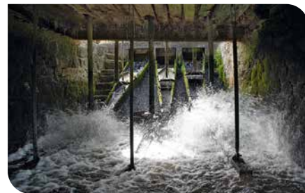
Ich will es genau wissen, krieche unter die Flussmühle.

Der Deutsche Mühlentag ist in diesem Jahr sehr zeitig. Am 21. Mai 2024, Pfingstmontag, öffnen zahlreiche Wind-, Wasser- und Motormühlen ihre Türen für die Gäste. Einfache Technik, die teilweise schon über 100 Jahre alt ist und funktioniert, wird verständlich erklärt und teilweise auch vorgeführt. Interessenten sollten zur Mühlenbesichtigung bitte festes Schuhwerk und nicht gerade die teuersten Sachen anziehen. In den hölzernen Rumpelbuden liegt Staub und manche Spinnweben sind scheinbar schon einige Generationen alt.