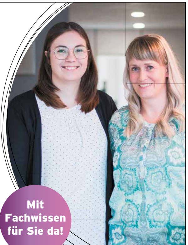
Ihr Hörconcept-Team aus Wurzen