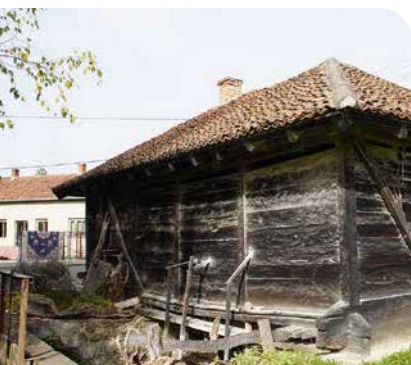
Glück zu – auf der Suche nach der Müllerstochter ... > Seite 20