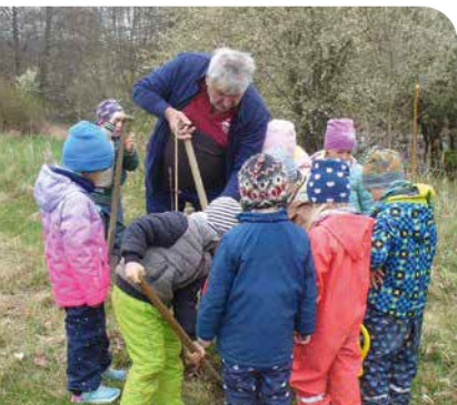
Kührener Kinder forsten Höckerberg auf > Seite 18