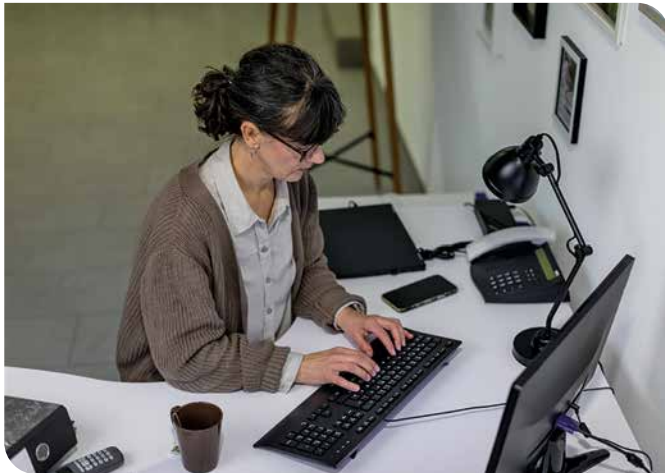
Diese Kauffrau für Versicherungen und Finanzanlagen mailt einem Kunden Informationsmaterial zur gewünschten Versicherung

Kaufleute für Versicherungen und Finanzanlagen betreuen und verwalten Verträge von Kunden am Computer. In der Kundenberatung suchen sie im Außendienst ihre Kunden vor Ort in deren Privatwohnungen oder Geschäftsräumen auf oder nehmen Schadenfälle in Augenschein; im Innendienst sind sie in Büroräumen tätig. Ihre Arbeit erledigen sie meist eigenständig, bei umfangreicheren Finanz- oder Versicherungskonzepten oder komplizierten Finanzierungs- bzw. Versicherungsfragen auch im Team. Kundengespräche führen sie ggf. in den Abendstunden oder am Wochenende, je nach den zeitlichen Möglichkeiten der Kunden.