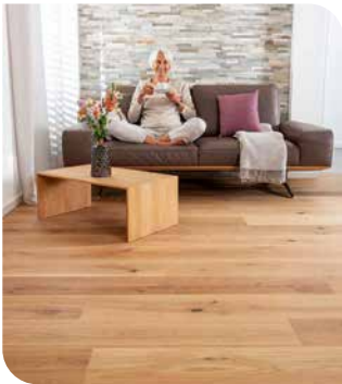
Echte Holzböden bringen ein warmes natürliches Ambiente ins Zuhause. Zugleich handelt es sich um einen besonders nachhaltigen Belag.

Parkettprofis können Bodenbeläge aus Holz aufbereiten und neu gestalten