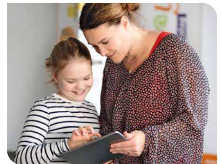
Auch Mädchen dürfen sich für Technik interessieren.

„Was wird es denn?“ ist eine der ersten Fragen, die werdenden Eltern gestellt wird. Sie bedeutet gleichzeitig den Start in eine weiblich oder männlich geprägte Erziehung, denn je nach Antwort geht es für die Kinder auf meist unterschiedlichen Wegen weiter. Neugeborene werden in rosa oder hellblau gekleidet. Und schon vielen Kindergartenkindern ist klar, dass Feen und Pferde eher Spielzeuge für Mädchen sind und Autos und Superheldenfiguren meistens für Jungs.