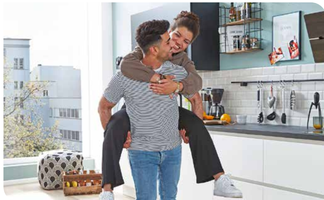
Gut geplant und nach dem eigenen Geschmack eingerichtet wird die erste eigene Küche zum Wohlfühlort.

Die fängt mit der Küchenform an: „Eine Küchenzeile passt in jeden Raum“, weiß Marko Steinmeier, Geschäftsführer von KüchenTreff, einer Einkaufsgemeinschaft von mehr als 500 inhabergeführten Küchenstudios und Fachmärkten in Deutschland und Europa. „Darin lässt sich alles, was man braucht, gut integrieren.“ Basics sind hier Kochfeld, Backofen, Kühlschrank und Spüle, dazu ausreichend Stauraum für Geschirr und Kochutensilien. Bei größeren Küchenformen – etwa der L- oder U-Form, einer zweizeiligen Küche oder einer mit Kochinsel – sollte auf