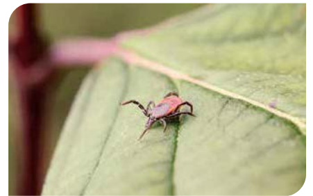
Achtung Zecke: Die Blutsauger können schon beim Stich gefährliche Krankheitserreger übertragen.