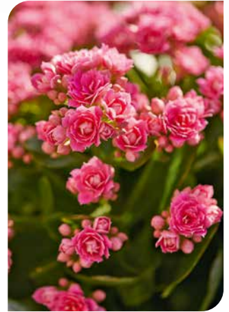
Wo andere Blumen auf dem Friedhof an heißen Sommertagen schon längst ihre Köpfe hängen lassen, überdauern Kalanchoë Garden unbeeindruckt bis zum nächsten Gießen oder Regenguss.

bereich angeboten. Auf dem Friedhof eignen sie sich vor allem für das Bepflanzen von Schalen, können aber auch direkt in den Boden gesetzt werden. Viele Wochen lang schmücken sie mit ihren farbigen Blütendolden, die sich aus dunklem Laub erheben und aus winzigen Einzelblüten bestehen, das Grab. Bei zahlreichen Kalanchoë Garden Sorten hält der Blütenflor tatsächlich mehr als drei Monate. Zu erkennen sind diese im Handel an dem Aufdruck „100daysflowering“. Dank gezielter Züchtungen gibt es die Kalanchoë heute mit einfachen und gefüllten Blüten sowie in vielen verschiedenen Farbtönen: Von Rot, Violett und Rosa über Gelb und Orange bis hin zu Creme und Weiß reicht die Palette. Je nach Auswahl und Kombination ist damit also sowohl eine bunte und lebendige als auch eine eher ruhige und harmonische Grabgestaltung möglich. Vor allem auf Grabstellen, die nicht von großen Gehölzen beschattet werden, blühen die Kalanchoë Garden prächtig. Die Sukkulenten kommen aber auch mit Halbschatten gut zurecht. Wenn es nicht regnet, sollten sie etwa einmal in der Woche gegossen