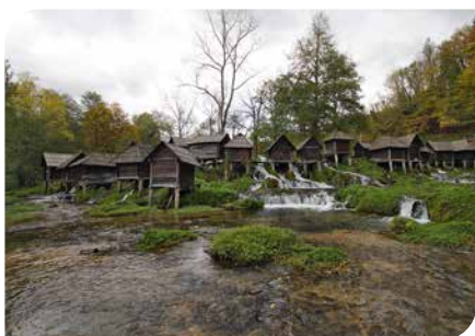
24 Flussmühlen in Jajce haben einst viel Mehl gemahlen und hungrige Mäuler satt gemacht.

Die Thallwitzer Sägemühle hat am Pfingstmontag ebenfalls ab 10.00 Uhr geöffnet, schon seit vielen Jahren organisiert der Heimatverein einen gemütlichen Mühlentag mit Kulturprogramm, Kaffee und Kuchen aus Mutter's Röhre sind köstlich.