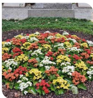
Bis in den Herbst hinein schmücken Kalanchoë Garden das Grab.

werden. Ist man verreist oder kann aus einem anderen Grund den Friedhof nicht besuchen, nehmen die Pflanzen das aber auch nicht krumm. Denn in ihren fleischigen Blättern speichern sie viel Flüssigkeit und können so eine etwas längere Trockenperiode problemlos überstehen. Wo andere Blumen auf dem Friedhof an heißen Sommertagen schon längst ihre Köpfe hängen lassen, überdauern Kalanchoë Garden unbeeindruckt bis zum nächsten Gießen oder Regenguss. Auch muss man sich keine Sorgen machen, dass sie von Tieren angeknabbert oder abgefressen werden. Weder Schnecken noch Kaninchen scheinen die blühenden Sukkulenten zu schmecken.