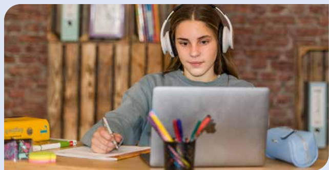
Ein aufgeräumter Schreibtisch hilft, sich auf das Lernziel zu fokussieren: Lernen-lernen-Kurse geben viele hilfreiche Tipps.

Gute Schulnoten haben nicht nur mit Intelligenz zu tun, sondern auch mit Fleiß und den richtigen Lerntechniken. Sie sind oft die Basis für dauerhaft bessere Leistungen. Und mit diesen Techniken können Schüler und Schülerinnen sich selbst unter professioneller Anleitung vertraut machen, um sich den Schulalltag zu erleichtern. Unter www.studienkreis.de/lernen-lernen-kurse beispielsweise werden interaktive Kurse für Kinder von der Grundschule bis zur Oberstufe angeboten. Die Teilnehmer lernen alles Wichtige rund um den persönlichen Lernprozess und machen sich hilfreiche Arbeitstechniken zu eigen. Die verschiedenen Lektionen dauern jeweils 60 bis 90 Minuten. Quizfragen und weiterführende Übungsaufgaben für das weitere Training zu Hause gehören ebenfalls dazu.