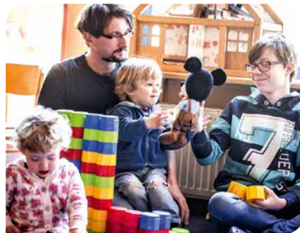
Wer spielt womit? Die Antwort sollte lauten: Jeder, wie er möchte!