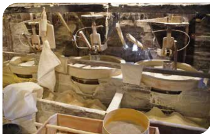
Drei Sorten Mehl werden gerade produziert.