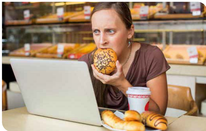
Arbeit, Stress, Termindruck: Im hektischen Alltag bleibt die gesunde Ernährung da oftmals auf der Strecke.

Warum sekundäre Pflanzenstoffe genauso wichtig sind wie Vitamine