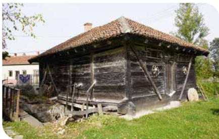
Eine Flussmühle in Serbien

Pfingstmontag 2024 ist Deutscher Mühlentag – was es alles gibt