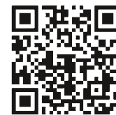
Foto: QR-Code zum Padlet

13.10.2023, ab 13:00 Uhr Offener Treff mit Ferienausklang