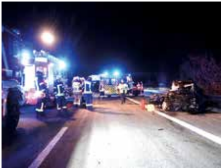
Zerstörter Pkw beim Verkehrsunfall am 30. Oktober

Am 15. November rückten die Kameraden zu einem Verkehrsunfall am Ortsausgang Fuchshain aus. Ein Motorradfahrer war beim Versuch zwei Pkw's zu überholen mit einem entgegenkommenden Fahrzeug frontal zusammengestoßen. Trotz sofort eingeleiteter Hilfemaßnahmen konnte dem Fahrer des Zweikraftrades nicht mehr geholfen werden. Er verstarb noch an der Unfallstelle. Der Fahrer des Pkw's wurde schwerverletzt in ein Krankenhaus gefahren. Vor Ort war auch ein