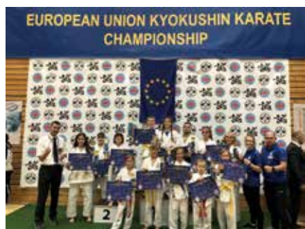
AktivSport SAXONIA Karate Wettkampfteam

den Kampf vorzeitig beenden und wurde am Ende des Tages Dritter. Der AS Saxonia unterstützte den Veranstalter bei der Durchführung des Turniers mit einem Kampfrichter und reiste abends mit 3x Platz 1, 2x Platz 2 und fünf dritten Plätzen zurück in die Heimat.