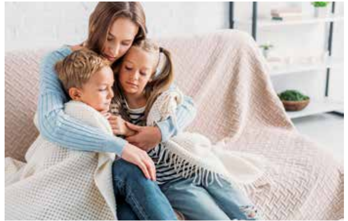
Manchmal erwischt es die ganze Familie – dann helfen hochwirksame ätherische Öle aus Heilpflanzen wie in Pinimenthol wieder fit zu werden.

Bewährt haben sich die hochwirksamen, wertvollen Wirkstoffe von Eucalyptus, Kiefernadel, Menthol und Campher im Arzneimittel Pinimenthol. Die hochkonzentrierten Öle gibt es als Erkältungsbad und Erkältungssalbe in der Apo-