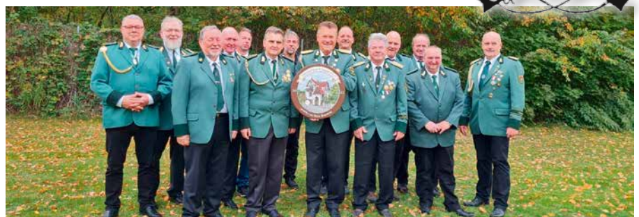
Gruppenfoto der Teilnehmer am Königsschießen