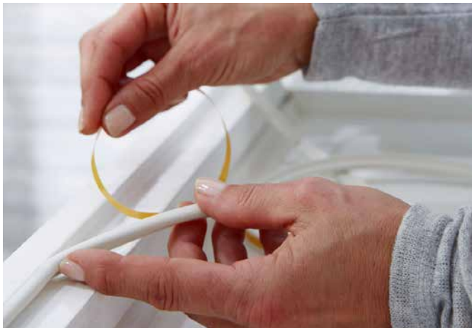
Energiesparen auf einfache Weise: Dichtungsstreifen verringern unangenehme Zugluft durch alte Fenster.