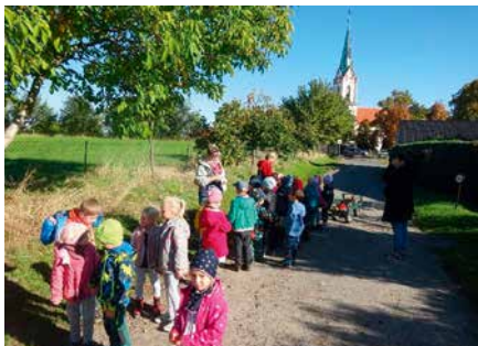
Herbstspaziergang durch Fuchshain