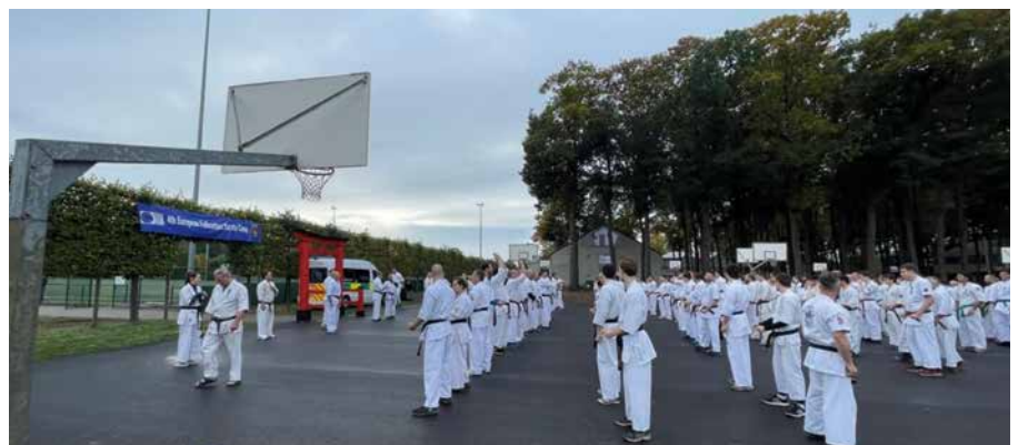
Training im Freien von über 200 Karatekas in Belgien