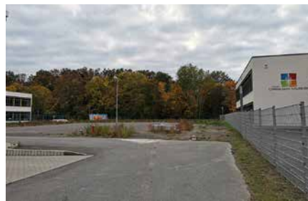
Freies Gymnasium Naunhof