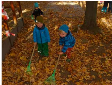
Gartenarbeit in der KITA

Jede Jahreszeit hat ihre besonderen Reize. So ist auch im Herbst wieder viel los. Wunderschöne Herbstspaziergänge laden zum Sammeln von Herbstfrüchten ein. Die ABC-Kinder absolvierten ihren ersten großen Ausflug in die Bibliothek Naunhof. Vielen Dank für den schönen Vormittag. Die Kinder der Regenbogengruppe bestaunten die Apfelpresse in Fuchshain, auch hier ein herzliches Dankeschön an die freundlichen Mitarbeiter.