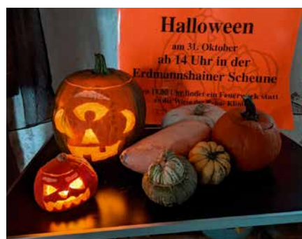
Anton hat schon seinen ersten Kürbis ausgehöhlt.

An dieser Stelle ein Aufruf zur Kürbisspende: in den vergangenen Jahren besuchten das Fest mehr als 120 Kinder und so viele Kürbisse können natürlich nicht bereitgestellt werden.