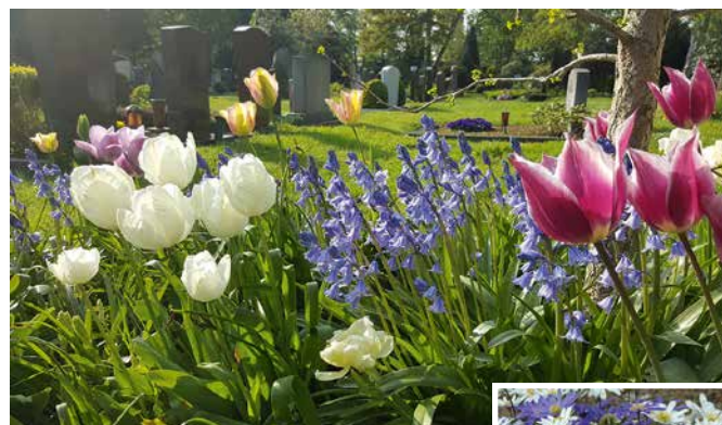
oben: Eine Freude auf dem Friedhof: Tulpen und Spanische Hasenglöckchen.

Blumenzwiebeln lassen sich mit einem einfachen Schippchen in die Erde bringen. Wie viele man wählt, ist natürlich abhängig