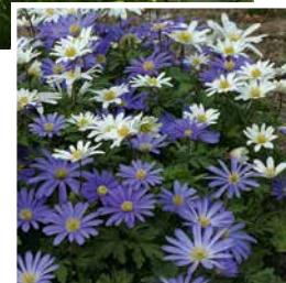
rechts: Die Anemone blanda ist in Weiß und Blau erhältlich.

von der Größe des Grabes. Je nach Gestaltung und Grundbepflanzung bieten sich unterschiedliche Arten und Sorten an. „Auch wer die Grabfläche komplett mit Bodendeckern wie Efeu oder dem Kleinen Immergrün gestaltet hat, muss auf bunte Frühlingsblumen nicht verzichten“, sagt van der Veek. „Einfach die Zwiebeln im Herbst tief genug zwischen die bestehende Bepflanzung in den Boden drücken ... Im Frühling wachsen die Frühblüher dann durch die geschlossene Pflanzendecke hindurch und nach der Blüte ziehen sie sich wieder zurück.“ Einmal gepflanzt, erscheinen die meisten Zwiebelblumen in jedem Frühjahr erneut. Viele vermehren sich im Laufe der Zeit sogar und lassen dann einmal im Jahr einen zauberhaften Blütenteppich entstehen – beispielsweise Anemone blanda oder Muscari, die es beide in Weiß und Blau gibt, die helle Puschkinia, das zierliche Schneeglöckchen oder verschiedenfarbige Krokusse.