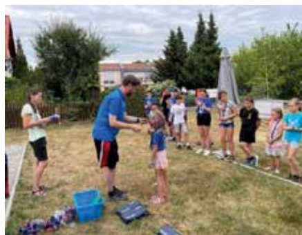
Siegerehrung der Teilnehmer

Am letzten Junimontag fanden die ersten Kreis Kinder- und Jugendspiele im Boule und Bogenschießen statt. Gemeinsam mit dem Kreissportbund des Landkreises Leipzig veranstaltete der AktivSport SAXONIA erstmalig in diesen neuen Disziplinen die traditionell jährlich stattfindenden Spiele. Nach verschobenem Termin in der Vorwoche konnten diesmal bei trockenem Wetter ca. 20 Kinder und Jugendliche zwischen 9 und 16 Jahren ihre Meister ermitteln. Zum Teil haben einige von ihnen das erste Mal an diesen Sportarten teil-