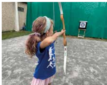
Früh übt sich, wer ins Schwarze (Gelbe) treffen will

genommen und das mit viel Spaß und Erfolg. Im Anschluß gab es ein gemütliches Beisammensein bei leckerem Gebrüllten und kühlen Getränken. Die Teilnehmer freuen sich bereits jetzt auf die kommenden Spiele im nächsten Jahr. Die nächsten Spiele des AktivSport SAXONIA dieses Jahr finden im Karate Vollkontakt am 02.07.2022 in der Oberschule Naunhof statt.