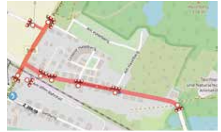
Vollsperrung im 2. Bauabschnitt vom 18. Juli bis 5. August

Mit der Sperrung des Bahnübergangs in der Polenzer Straße (S 45) in Am-