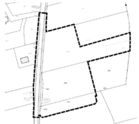
Auszug Planzeichnung: Darstellung räuml. Gel- tungsbereich des Bestandes