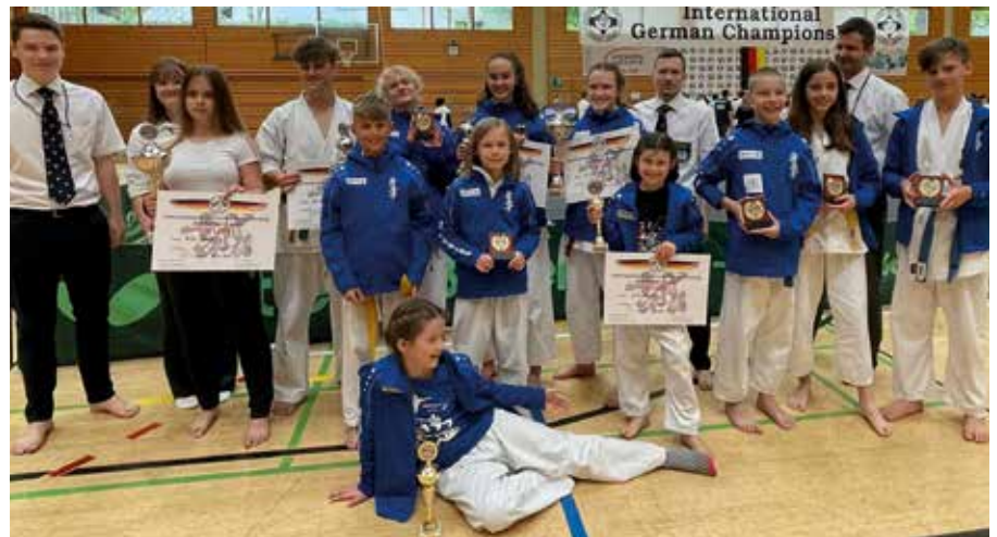
Das Karate Wettkampteam des AktivSport SAXONIA