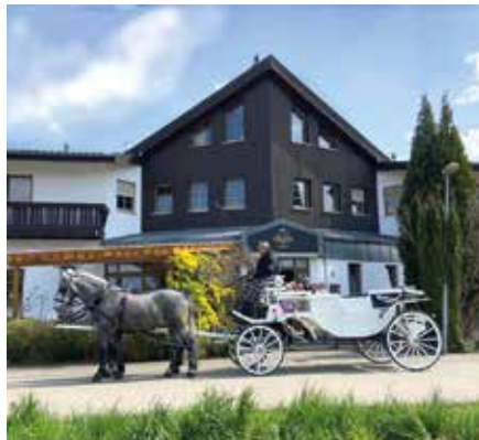
Mit der Pferdekutsche zur Feierlichkeit: das macht jedes Event besonders.

Wenn Sie Ihren Abend langfristig planen wollen, reservieren Sie gerne vorab einen Tisch. Das geht einfach online unter www.showhotel-seerose.de oder schreiben Sie uns info@showhotel-seerose.de oder rufen Sie an 0170 – 376 9414.