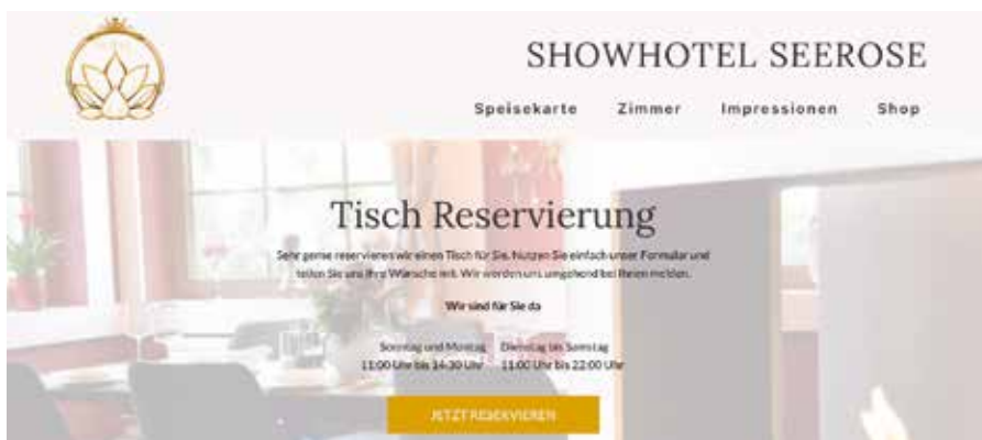
Unsere neue Homepage: www.showhotel-seerose.de .

Hier finden Sie uns: Kiebitzgrund 1, 04824 Beucha www.showhotel-seerose.de