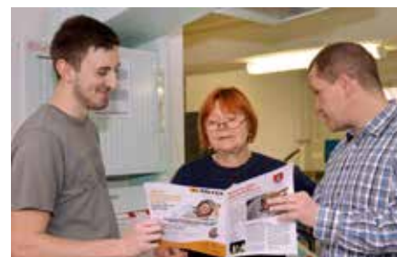
Der erste Andruck der Ausgabe 01 / 2014

„Seit der Gründung der Bornaer Druckerei im Jahre 1841 wurden im DRUCKHAUS BORNA neben allen klassischen Journale, Amtsblätter, Zeitungen, Zeitschriften und Bücher hergestellt. Begonnen hatte alles mit dem „Wochenblatt für Borna und Umgebung“ am 22.12.1841. Seither hat sich eine Menge verändert. Ob Papier, Farbigeit, Druckqualität oder digitale Satzherstellung – nicht viel erinnert mehr an die alte Zeit des Gutenberg’schen Buchdrucks. Geblieben ist allerdings unser journalistischer Anspruch, zwei Mal im Monat die Leser über das Aktuelle und Wissenswerte in ihrer Stadt und in der Region umfassend zu informieren.“ Diesen Anspruch haben wir auch heute noch. Mittlerweile haben die Naunhofer Nachrichten ein Redesign