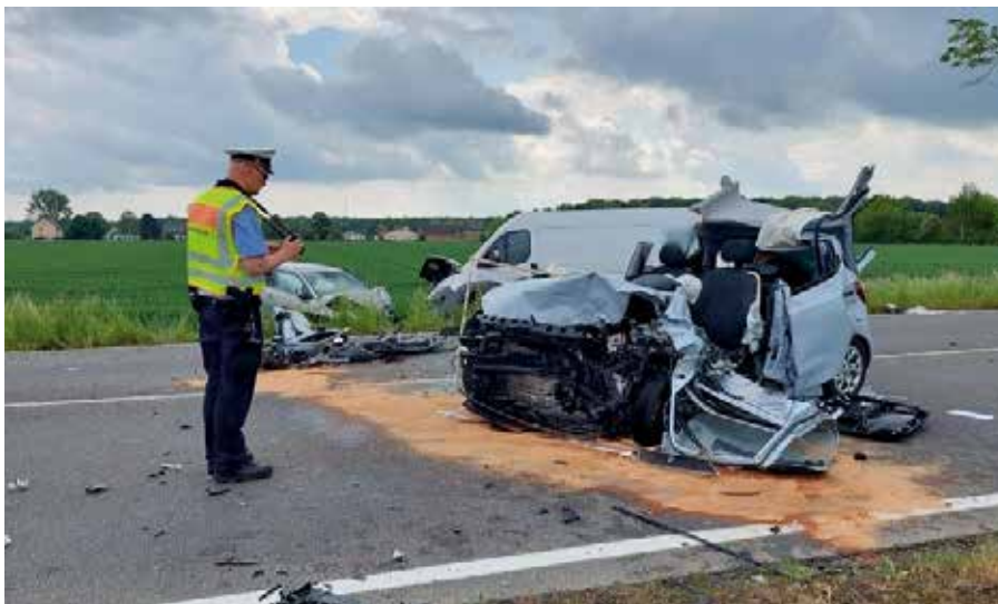
Noch während die Rettungsarbeiten zum Verkehrsunfall am 17. Mai liefen, nahm die Polizei schon die Ermittlungen zum Unfallhergang auf.

Feuerwehr Einsatzgeschehen seit Mitte April