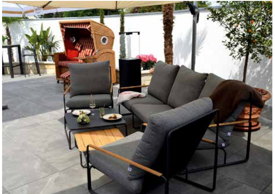
Unser sommerlicher Freisitz lädt zu gemütlichen Stunden ein.

Wir haben unseren langersehnten Freisitz für Sie eröffnet. Damit steht einem geselligen Zusammensein mit Freunden an milden Sommerabenden nichts mehr im Weg. Bei Vogelgezwitscher und gelegentlich toller Livemusik können Sie unser leckeres, saisonales Essen unter freiem Himmel genießen und ganz nebenbei schöne Dinge für Ihr zu Hause erwerben. Denn unser Showhotel-Motto gilt auch für unsere Gartenmöbel. Sie können bei uns unterschiedliche Sitzgruppen, Tische und Stühle ausprobieren. Das bietet viele Vorteile. Während Sie sonst im Einzelhandel einfach anhand der Optik oder des Materials ihre Kaufentscheidung treffen, können Sie die Möbel bei uns live ausprobieren. Sind die hübschen Gartenmöbel auch nach einem langen Abend mit Freunden noch gemütlich? Testen Sie es bei uns aus!