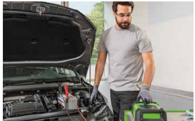
Mobile Batterieladegeräte sorgen im Handumdrehen für frische Energie.

Zusätzlich zu den eigenen Pflegearbeiten empfiehlt sich ein Batteriecheck in der Fachwerkstatt ein- bis zweimal pro Jahr. Die Profis können die Spannung kontrollieren und Mängel an altersschwachen Batterien erkennen, bevor sie zu einer Panne führen. Sie beraten auch bei einem Batterietausch dazu, welches Modell sich für das eigene Auto am besten eignet. Modelle wie die S5 AGM oder S4 EFB von Bosch etwa sind speziell auf besonders viele Ladezyklen ausgelegt. Adressen aus der Nähe findet man mit dem Werkstattfinder unter www.boschcarservice.de .