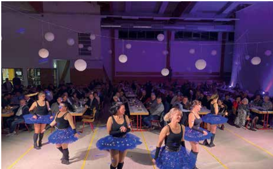
Auftakt mit der Tanzgruppe TANZBAR