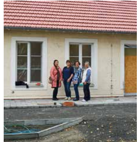
Wir freuen uns auf Sie in der Hugo-Aurig-Straße 7, direkt gegenüber dem ALDI Engelsdorf.