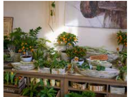
Das erfolgreiche Naunhofer Konzept – Blumenarrangements zu jedem Anlass, farbenfrohe blühende Pflanzen für den Innen- und Außenbereich, köstliche Präsente und zauberhafte Dekorationen – hält nun auch in Leipzig / Engelsdorf Einzug.