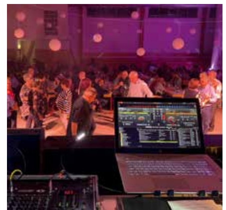
Tanz mit der Showkiste Leipzig

Auch im kommenden Jahr sucht die Stadt Naunhof wieder Menschen, die sich im Stillen und Verborgenen für das Gemeinwohl einsetzen. Kennen auch Sie solche „Glanzlichter“, so sind Sie herzlich eingeladen, diese für die Auszeichnung in 2022 vorzuschlagen.