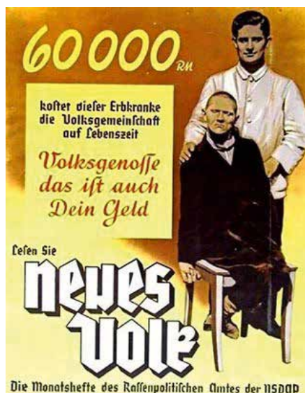
Plakat mit nationalsozialistischer Propaganda um 1938 zur Verhütung erbkranken Nachwuchses.

19. September 1940 wie im Mittelalter kahlgeschoren im Oschatzer Pranger 4 Stunden zur Schau gestellt und verhöhnt. Eine Zuchthausstrafe, wie sie andere Frauen in ähnlichen Fällen erleiden mussten, blieb ihr erspart.