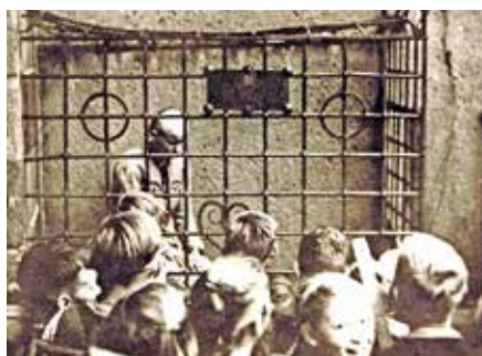
Schaustellung Dora von Nessen im Pranger am Oschatzer Rathaus als „ehrtlos gewordene Frau“. Die Lehrer wurden aufgerufen, mit ihren Schulklassen die junge Frau zu begaffen und zu beleidigen.

19. September 1940 wie im Mittelalter kahlgeschoren im Oschatzer Pranger 4 Stunden zur Schau gestellt und verhöhnt. Eine Zuchthausstrafe, wie sie andere Frauen in ähnlichen Fällen erleiden mussten, blieb ihr erspart.