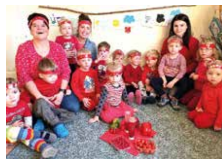
Farbenprojekt „Schlaue Füchse“