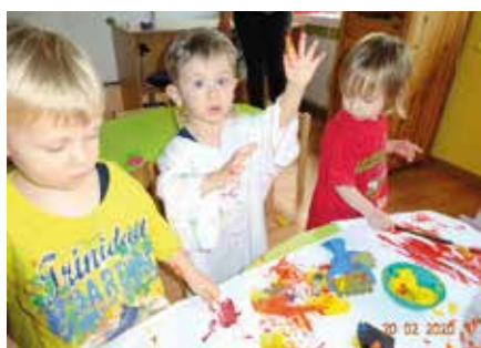
Angebot Farben „Kleine Mäuse“