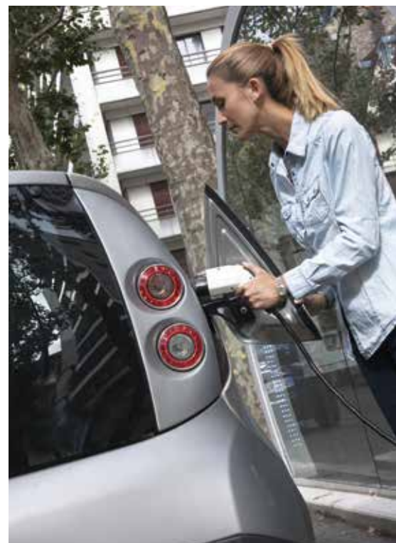
Bei einem E-Auto sollte der Akku auch gegen versehentliche Bedienfehler versichert sein.