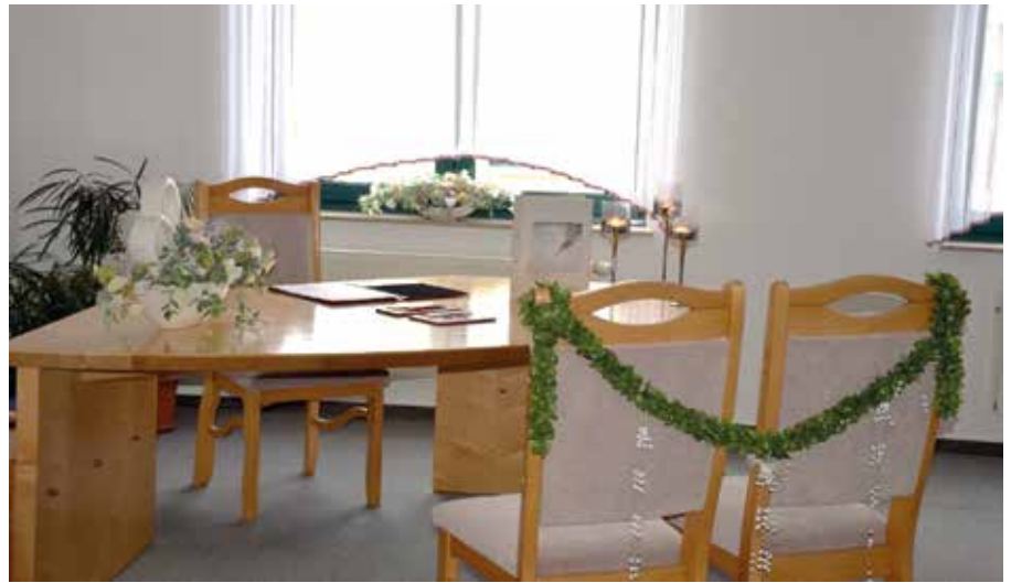
Traumzimmer im Naunhof Rathaus