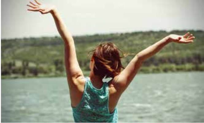
Eine Operation ist nicht immer nötig.

Experten sind der Ansicht, dass Patienten in vielen Fällen vor schnell zu einer Operation geraten wird. Bei Frauen beispielsweise zählt die Entfernung der Gebärmutter weltweit zu den häufigsten gynäkologischen Eingriffen. Ein Grund für die sogenannte Hysterektomie sind oft starke und schmerzhafte Regelblutungen. Doch für deren Behandlung ist ein solch radikaler Eingriff nicht immer nötig: Eine Verödung der Gebärmutter Schleimhaut (Endometriummablation) bietet in vielen Fällen eine schonende Alternative.