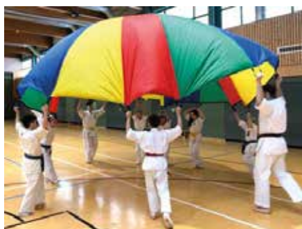
Sichtlich Spaß haben die Kinder und Jugendlichen mit dem neuen Schwungtuch

Der AktivSport SAXONIA bietet wiederholt in diesem Jahr einen Erste-Hilfe-Kurs in Kooperation mit dem DRK Muldentale an. Am Samstag, den 9. Mai findet dieser für alle