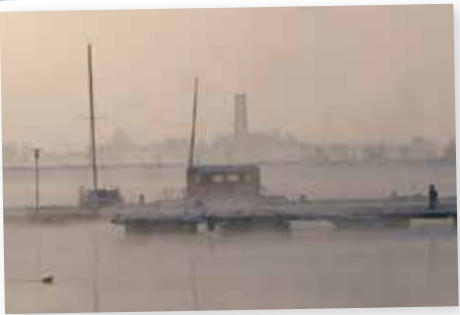
Nebel macht sich breit über dem See