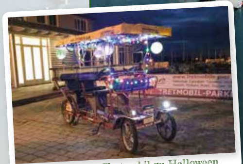
Geschmücktes Tretmobil zu Halloween

Wichtig: Verbindliche Buchungen für Halloween nehmen wir bis Mittwoch, den 27. Oktober telefonisch unter 0152 29244535 entgegen. Die Mindestzeit bei Reservierungen beträgt wie gehabt zwei Stunden. rn