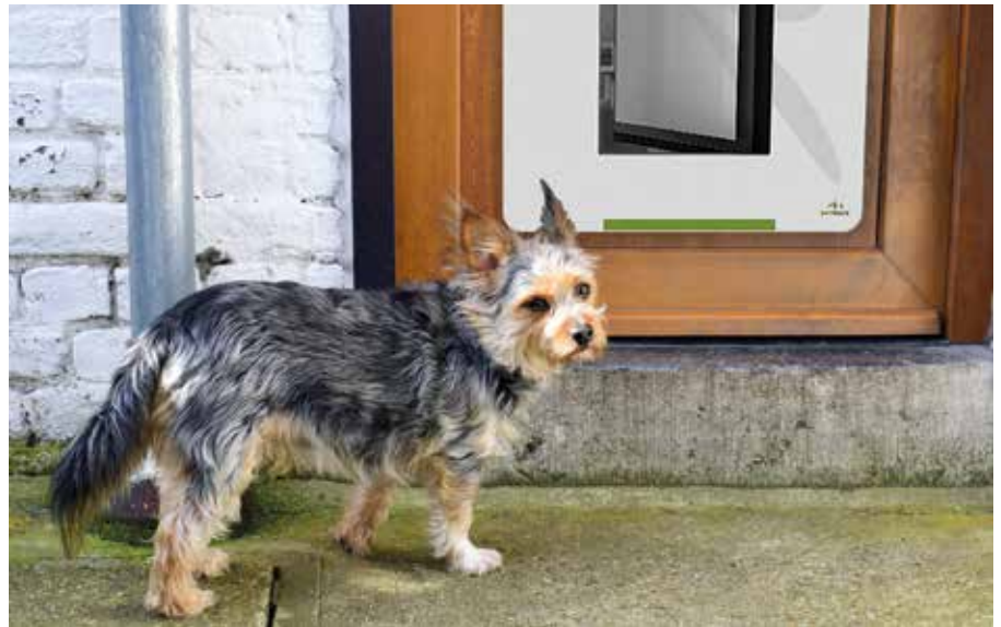
Ältere Hunde müssen öfter „mal raus“. Mit einer Tiertüre kann sich der Vierbeiner jederzeit selbst entscheiden, wann er „Gassi gehen“ möchte.

Gerade bei Gelenkbeschwerden oder Inkontinenz ist der selbstständige Zugang ins Freie für Hund oder Katze eine große Erleichterung. So können sie die Häufigkeit und Länge des Ausgangs nach Notwendigkeit anpassen. Ersatz für eine Gassirunde ist das zwar nicht, aber eine von den Tieren gerne angenommene Option für dringende Geschäfte. Vom Hersteller Petwalk beispielsweise gibt es zwei Modelle