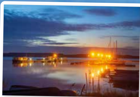
Stimmungsvolle Dämmerung über dem Cossi