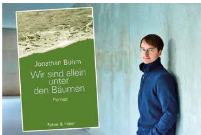
(Cover: Verlag Faber & Faber)

Das Literaturforum Bibliothek – Autorinnen und Autoren aus Sachsen in sächsischen Bibliotheken – kann im Herbst 2021 endlich wieder live stattfinden.