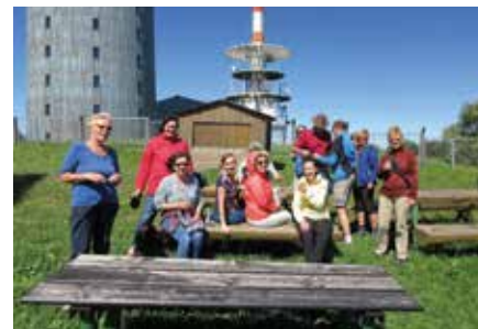
Ausflüge, etwa auf den Großen Inselfberg, bereichern unser Vereinsleben.

Unser Verein wurde erst 2017 gegründet. Vielleicht hat der eine oder andere schon von uns gehört oder gar Auftritte beim Stadtfest oder dem Fest der 25.000 Lichter im agra-Park miterlebt. Dort präsentieren wir auch regelmäßig einfache Tänze zum Mitmachen. Unsere derzeit 28 Mitglieder haben alle Spaß am Tanzen. Über den Sport hinaus sind wir gut befreundet und feiern auch schon mal zusammen. Wir treffen uns zu Gartenpartys, Wandertagen, Weihnachtsfeiern und Vereinsausflügen. Eigentlich ist immer etwas los.