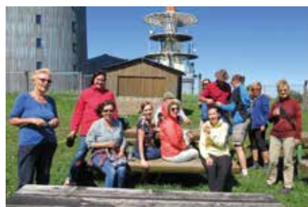
Verein Star Promenaders Markkleeberg e.V.