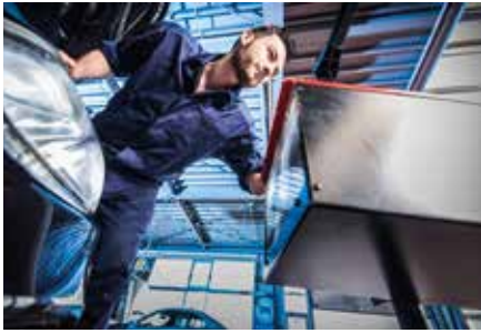
In die Kfz-Meisterwerkstatt zum Licht-Test: So behalten Autofahrer den vollen Durchblick.

Blindflüge sind nur etwas für gut ausgebildete Flugzeugpiloten. Autofahrer jedoch müssen sich immer noch auf ihr Sehvermögen verlassen. Ein guter Durchblick bei schlechten Sichtverhältnissen ist nur dann gewährleistet, wenn auch die Fahrzeugbeleuchtung perfekt funktioniert. Aus diesem Grund gibt es bereits seit 1956 den Licht-Test, den viele Autohäuser und Kfz-Werkstätten jährlich ab Oktober