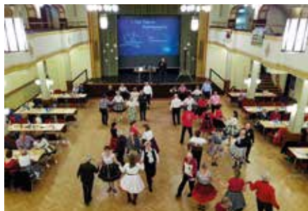
Am 26. Januar 2019 fand unser 1. Star Dance im Großen Lindensaal statt.