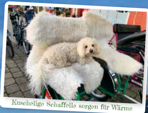
Kuschelige Schaffelle sorgen für Wärme