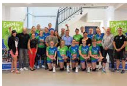
Markkleeberg aktuell Saisonstart der Neuseenland Volleys