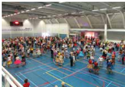
Wir nehmen auch an internationalen Treffen teil – hier 2018 in Amsterdam.