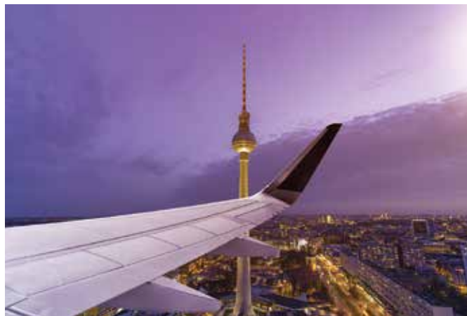
Nach einer Entscheidung des Europäischen Gerichtshofs besteht kein Anspruch auf Entschädigung bei Umleitung auf einen nahen Flughafen.

„Die Entscheidung ist absolut richtig, denn die Fluggastrechte-Verordnung soll Passagiere bei Verspätungen von drei oder mehr Stunden pauschal für die Unannehmlichkeiten entschädigen. Besonders begrüßen wir, dass der EuGH im Sinne der Verbraucher weiterhin an den drei Stunden Verspätung am eigentlich gebuchten Endziel festhält und etwaige zusätzliche Trans-