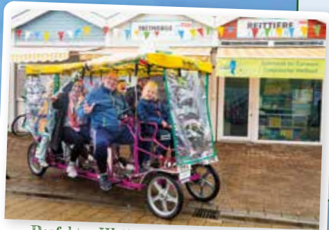
Perfekter Watterschutz für Regentage

Noch den ganzen Oktober haben Sie Gelegenheit zu einer Seerunde, bevor die Tretmobile ihren „Winterschlaf“ antreten. Eine Reservierung empfiehlt sich, insbesondere in den Herbstferien und am Wochenende. Immer mit dabei ist die Bordverpflegung, die Sie bei Ihrer Abfahrt am Pier 1 erhalten. bw