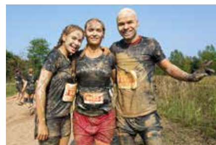
Markkleeberger Bilderbogen CrossDeLuxe