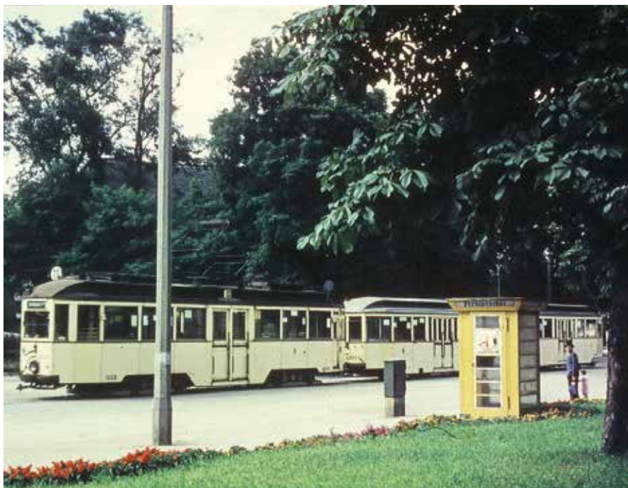
Straßenbahn der Linie 11 in der Bornaischen Straße