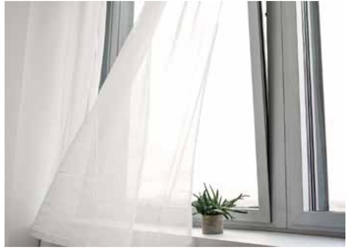
Richtiges Lüften ist wichtig für ein gutes Raumklima im Schlafzimmer – lieber eine Weile stoßlüften, statt das Fenster ständig gekippt lassen.

Bitte messen: Die Luftfeuchtigkeit in einem Schlafrum sollte zwischen 40 und 60 Prozent liegen.