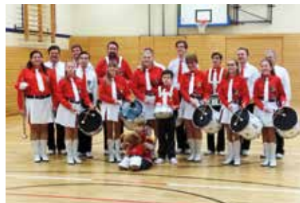
Markkleeberg aktuell Endlich wieder gemeinsam musizieren