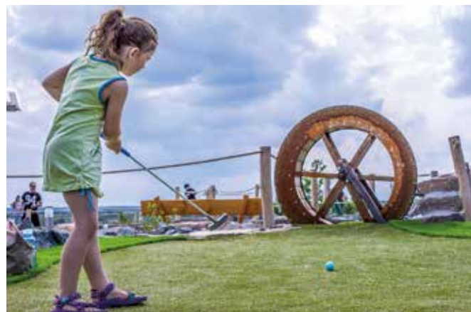
Die Adventure-Golf-Anlage am Markkleeberger See lädt wieder Groß und Klein zum Spielen ein

Die Verweil- und Adventure-Golf-Anlage ist im Gelände des Kletterparks zu finden. Auf den zwölf begrünten Bahnen gilt es Höhen, Findlinge und Brücken über einen Bachlauf zu umspielen, um den Golfball mit möglichst wenigen Schlägen einzulochen. Adventure-Golf kann von jedermann ohne Vorkenntnisse gespielt werden. Geöffnet hat die Anlage bis Oktober immer mittwochs bis sonntags sowie an Feiertagen von 11.00 bis 18.00 Uhr. In den sächsischen Schulferien kann in dieser Zeit täglich gegolft werden. Erwachsene und Jugendliche zahlen für eine Runde sechs Euro, Kinder von sechs bis 14 Jahren 4,50 Euro. Kinder bis fünf Jahre spielen kostenlos, wenn sie in Begleitung eines erwachsenen Spielers sind. Informationen gibt es unter www.adventuregolf-markkleeberg.de .