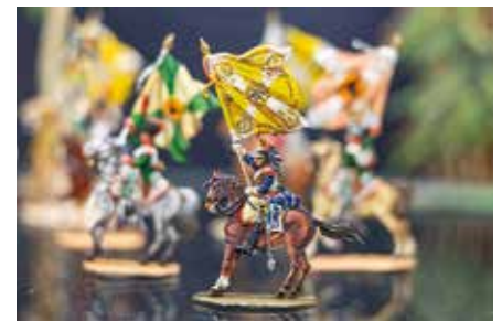
Veranstaltungen Sonderausstellung im Torhaus Dölitz