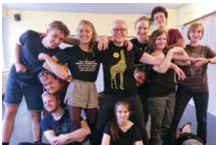
Verein Junge Gemeinde der Martin-Luther-Kirche