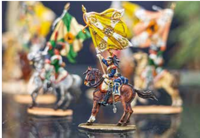
Präsentation der erbeuteten Fahnen nach der Schlacht bei Austerlitz

Neue Sonderausstellung im Zinnfigurenmuseum im Torhaus Dölitz: „Napoleonische Kriege extra: 1805 – 1815“