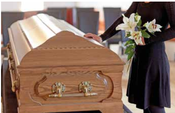
Mit einem Video-Live-Stream können Angehörige, Freunde und Bekannte von überall direkt bei der Trauerzeremonie mit dabei sein.

an Printmedien. Im Online-Kondolenzbuch können Hinterbliebene in aller Stille mit persönlichen Worten kondolieren oder ihre Anteilnahme durch Anzünden virtueller Kerzen oder durch einen digitalen Blumengruß ausdrücken. Danksagungen können erstellt und beispielsweise mit Fotos von der Beerdigung versendet werden. In lebendiger Erinnerung bleiben die Verstorbenen mit einer persönlichen Gedenkseite, auf der Angehörige Briefe, Geschichten, Informationen und Fotos teilen können. Das macht das Trauern überall möglich und spendet Trost. Mithilfe von QR-Codes auf dem jeweiligen Grab können Besucher diese Seite auch direkt über das Smartphone bei einem späteren Friedhofsbesuch aufrufen. djd