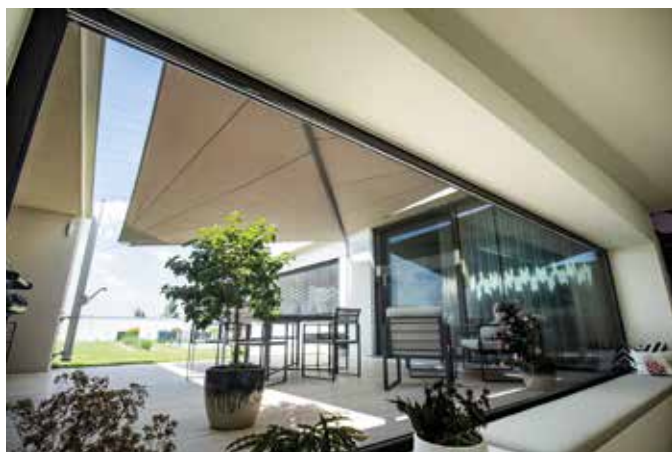
Je nach Anforderung und Beschattungsfläche kann man zwischen vier verschiedenen aufrollbaren Systemen für eine richtig „coole“ Großflächenschattierung wählen.

Mit maßgefertigten Sonnensegeln wird der Außenbereich zur Wohlfühl-Oase