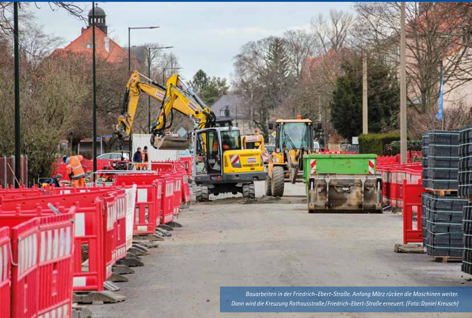
Bauarbeiten in der Friedrich-Ebert-Straße. Anfang März rücken die Maschinen weiter. Dann wird die Kreuzung Rathausstraße/Friedrich-Ebert-Straße erneuert.

Amts- und Mitteilungsblatt der Großen Kreisstadt Markkleeberg