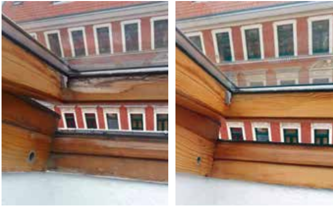
Vor und nach der Sanierung eines Dachflächenfensters.

Hurra, wir leben noch! Nach einem schwierigen Umzug aufgrund der Straßensanierung der Friedrich-Ebert-Straße sind wir im Equipagenweg 21–23 in Markkleeberg angekommen. Zunächst noch ohne Telefon- und Internetanschluss, ist die Firma FEWA39 nun wieder zu einhundert Prozent arbeitsfähig. Wir danken allen Hausverwaltungen, Wohneigentümern und Privatkunden für ihr Verständnis für die teilweise unvermeidlichen Störungen.