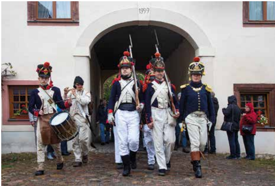
Uniformierte am Torhaus Markkleeberg

Im Zusammenhang mit den späteren Ereignissen der Völkerschlacht bei Leipzig waren die Truppen des französischen Kaisers Napoleon Bonaparte bereits im Frühjahr 1813 wiederholt erfolgreich weit in die Mitte Deutschlands vorgerückt. Doch der Druck der Verbündeten erzwang schließlich in der zweiten Oktoberhälfte 1813 eine Entscheidungsschlacht im Raum Leipzig. Mit dem rechten Flügel der Schlachtordnung an das Pleißetal angelehnt, musste sich Napoleon dann hier im Südosten der Stadt der Kampfhandlung stellen. Die Rittergüter Markkleeberg und Dölitz waren von Österreichern besetzt. Besonders verlustreich waren der Kampf zwischen der französischen Halbbrigade Aymard und dem österreichischen Kaunitz-Infanterie-Regiment Nr. 20 um das Rittergut Markkleeberg, die Auenkirche, die Pleiße-