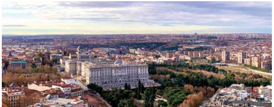
Panoramablick von der Rooftop-Bar

Unsere Jahrestagung fand 2019 in Spaniens traumhafter Hauptstadt Madrid statt – die Lufthansa bietet ab Leipzig über München Flüge nach Madrid an. Von Mad-