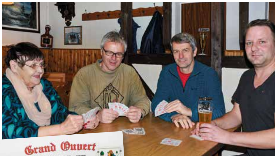
Geselliger Skatabend in der „Wartburg“

Das Skaten findet als Preisskat mit zwei Mal 48 Spielen statt, der Einsatz beträgt zehn Euro pro Spieler. Spielbeginn ist jeweils 17.30 Uhr, die Spielzeit geht bis circa 22.00 Uhr. Momentan besteht die Skatrunde aus vier Herren, alle sind Mitglied im TSV 1886 Markkleeberg – zwei von ihnen nahmen am 25. und 26. Januar an den Einzelmeisterschaften in Schkeuditz teil. Im April möchte sich die Sektion –