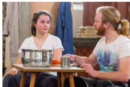
Markkleeberg aktuell „Krippenspiel“ ohne Krippe