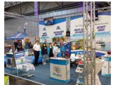
Der Kanupark präsentiert ab 20. Februar mit seinen Partnern auf der „Beach and Boat“

Vom 20. bis 23. Februar findet in Leipzig die „Beach and Boat“ statt. Auch in diesem Jahr ist der Kanupark wieder als Aussteller auf Mitteldeutschlands größter Wassersportmesse zu Gast. Er präsentiert sich gemeinsam mit seinen Partnern Seepark Auenhain, Kletterpark und Adventure-Golf Anlage am Markkleeberger See und der Personenschiffahrt Leipziger Neuseenland in der Halle 2 am Stand H09. Neben diversen Informationsmaterial sowie Präsentationsvideos hat das Messteam auch ein Gewinnspiel dabei, mit dem die Besucher unter anderem ein Rafting-Erlebnis gewinnen können. Die „Beach and Boat“ hat täglich von 09.30 bis 18.00 Uhr geöffnet. Weiterführende Informationen zur Messe sind im Internet unter www.beach-and-boat.de zu finden.