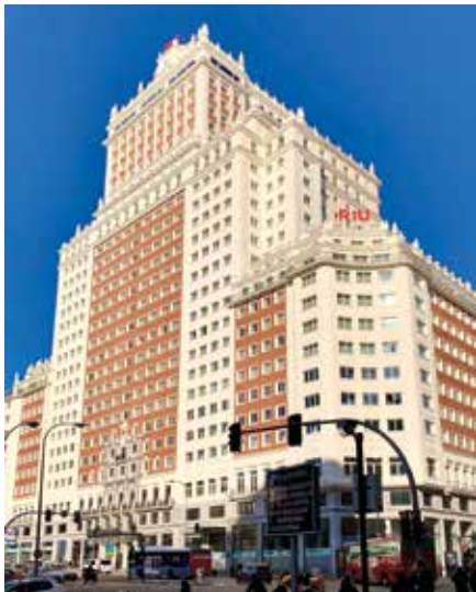
Riu-Hotel an der Plaza de España