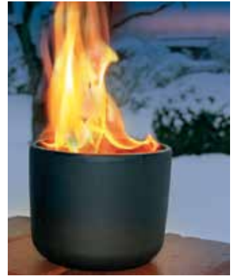
Faszinierendes Lichtspiel

Wenn es früh dunkel wird und Schnee oder Raureif die Natur bedecken, dann lässt ein Feuer den Garten in einem warmen Licht erleuchten und die Eiskristalle glitzern. Was auf den ersten Blick als Gegensatz erscheint, verschmilzt im Dunkel des Winters zu einer stimmungsvollen Liaison: Im Schein der Flammen erstrahlen Eis und Schnee in einem faszinierenden Glanz.