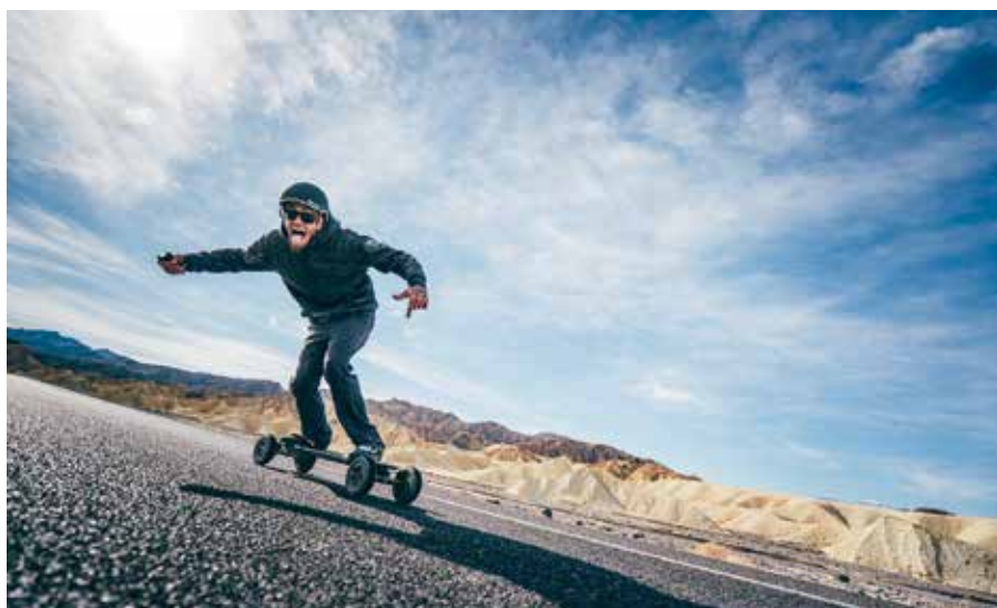
Ein Elektroskateboard kostet etwa halb so viel wie ein gutes E-Bike und lässt sich zu jeder Jahreszeit fahren.