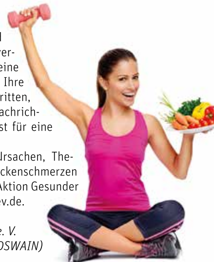
PM Aktion Gesunder Rücken e. V.

Weitere Informationen zu Ursachen, Therapie und Prävention von Rückenschmerzen gibt es auf der Webseite der Aktion Gesunder Rücken e. V. unter www.agr-ev.de .