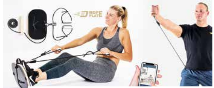
Training im MED4FIT oder mit RopePlate zu Hause

se sind weitere Alternativen, hier gibt es nur leider extreme Qualitätsunterschiede, die für den Laien kaum zu unterscheiden sind. Auf Yoga allein, sollte sich dabei allerdings niemand verlassen, die Belastung ist fast überall viel zu gering, hier ist Pilates je nach Trainer immer vorzuziehen! Eine perfekte Ganzkörpertrainingsvariante mit sehr guter Rückenkräftigung ist über die Nutzung von RopePlate oder Dewboard möglich. Hier stehen bis zu 100 Kraftübungen, Trainings- und Diagnostik-APP und stufenlose Gewichtseinstellung bis 200 kg zur Verfügung. Dabei sind die soliden Boards trotzdem klein, transportabel, leise und nur 3-9 kg schwer. Durch die aktuelle Aktion ist es möglich beide Multiseilzug-Geräte 30 Tage kostenlos zu Hause zu testen und eine persönliche gratis Video-Einweisung mit einem Trainer zu erhalten. RopePlate ist die günstigste Variante für den Einstieg in das revolutionäre Trainingsprinzip. Mehr Infos unter www.dewboard.de oder unter www.ropeplate.de .