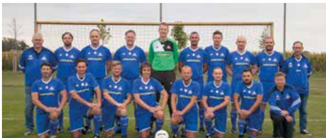
Seniorenmannschaft