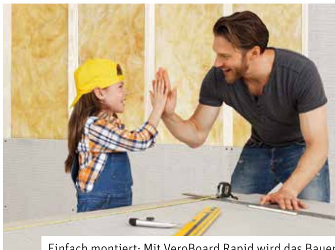
Einfach montiert: Mit VeroBoard Rapid wird das Bauen zum Kinderspiel.