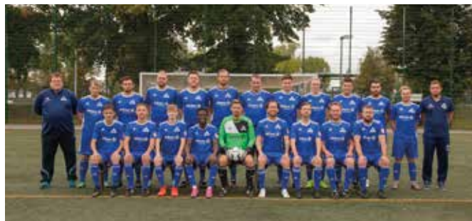
2. Herren

Trainer Heiko Greunke belächelt dies zwar und bleibt bei der Zielstellung weiter bescheiden, doch abgesehen von der