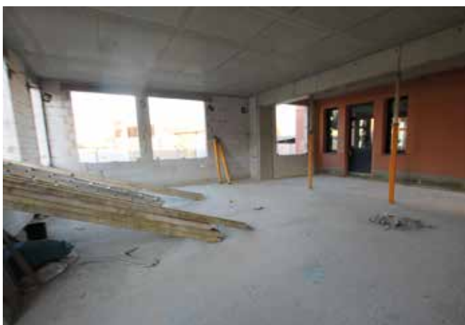
Erweiterung Speiseraum Innenansicht