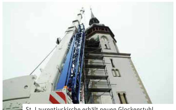
St. Laurentiuskirche erhält neuen Glockenstuhl

Mit der Ertüchtigung des Glockenstuhls steht in diesen Tagen eine weitere Etappe der Sanierung der St. Laurentiuskirche vor dem Abschluss. Weil die über 100 Jahre alte Stahlkonstruktion deutliche Mängel aufwies, wurde sie in den vergangenen Monaten zurückgebaut und durch einen neuen Glockenstuhl aus Eichenholz ersetzt. Die Kosten für dieses Vorhaben belaufen sich auf rund 130.000 Euro. Etwa zwei Drittel davon wurden von Bund und Freistaat Sachsen bereitgestellt. Der Markranstädter Stadtrat hat im Oktober beschlossen, das Vorhaben mit 15.000 Euro zu unterstützen, die Kirchengemeinde brachte zudem einen Eigenanteil in Höhe von 4.700 Euro ein. Am 9. Dezember wurden die Bauarbeiten im Turm vorübergehend auch für die Passanten rund um den Marktplatz sichtbar. Lesen Sie weiter auf Seite 24.