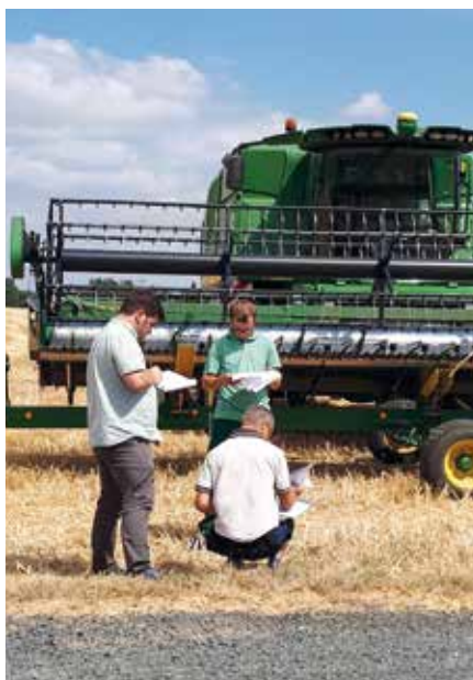
Arbeiten und Leben auf dem Land. Jungen Menschen, die sich für einen landwirtschaftlichen Beruf entscheiden, werden zahlreiche Karrieremöglichkeiten geboten.