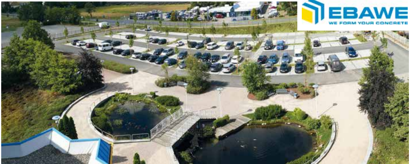
Der neu gestaltete Parkplatz bei EBAWE in Eilenburg bietet 140 Stellplätze und zukünftig auch zwei E-Ladesäulen.