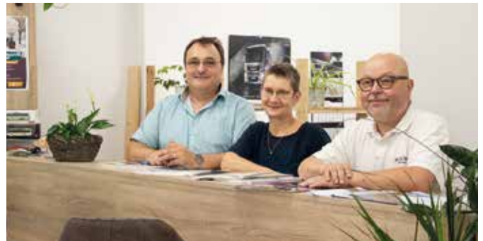
Mitarbeiter der Drive & Travel GmbH im Reisebüro