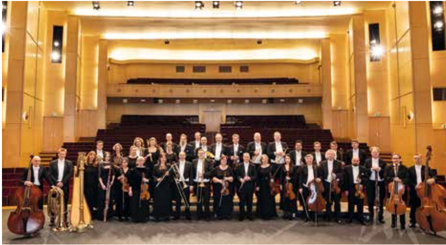
Das Leipziger Symphonieorchester gestaltet in diesem Jahr das Festkonzert zu Jubiläum der deutschen Wiedervereinigung.

Ein Abend mit klassischer Musik im KulturGut Thallwitz