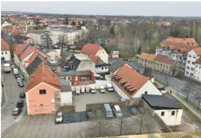
Blick auf die Gebäude Frauengasse 13 – 15 und die alte Kelterei am Schlossplatz.

Nicht häufig behandeln die Großenhainer Stadträte Beschlüsse, die derart viele Jahre der Vorbereitung, der Diskussionen, der fachlichen Untersuchungen und Abwägungen aber vor allem so viel Herzblut aufweisen können wie die Beschlussvorlage 11/2023 SR. Mit dieser stimmte der Stadtrat der Stadt Großenhain in seiner jüngsten Sitzung mit großer Mehrheit für die Planung eines Gebäudekomplexes am Schlossplatz, der das Museum, die Begegnungsstätte, Angebote einer Tourist-Information und vor allem die seit langen benötigten Lagerräume für das Kulturschloss in sich vereinen soll. Damit stellte der Stadtrat zugleich die Weichen für eine Bündelung von Kultur-, Kunst- und Begegnungsangeboten an diesem städtebaulich interessanten, historisch wertvollen und touristisch attraktiven Standort.