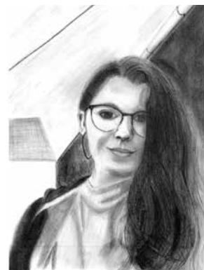
Skizze: Antonia Maria Dörschel

Die Ausstellung ist während der Öffnungszeiten des Rathauses in der 1. Etage für Besucher geöffnet. Bei Interesse an den ausgestellten Bildern stellt die Stadtverwaltung Großenhain gern den Kontakt zur Künstlerin her.