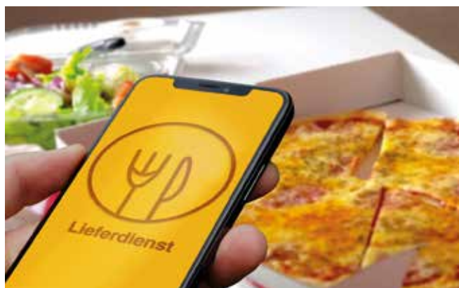
Am besten noch im Beisein des Lieferanten die Temperatur des gelieferten Essens prüfen.

Anmerkung: Das auf dieser Seite behandelte redaktionelle Thema stellt keine rechtlich verbindliche Beratung durch den Verlag dar. Diese erhalten Sie ausschließlich bei Rechtsanwälten, Notaren, Versicherungsberatern, Steuerberatern, Lohnsteuerhilfen und dgl.