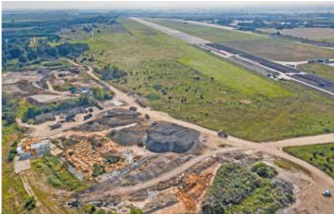
Aufnahme des Geländes des ehemaligen Flugplatzes (Archivaufnahme 2021)