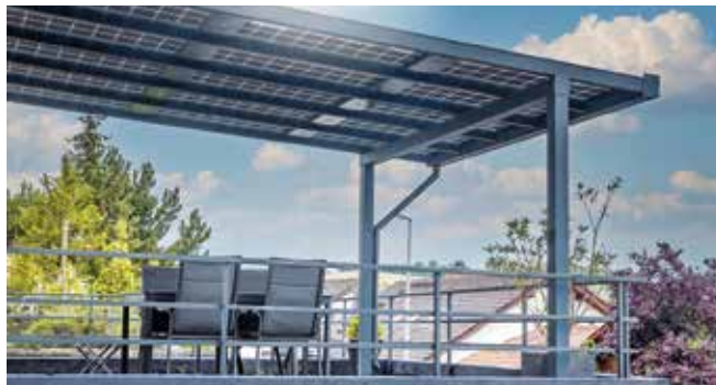
Die Sonne sorgt für gute Laune - erst recht, wenn selbst erzeugter Solarstrom bares Geld spart und unabhängiger vom öffentlichen Netz macht.

Vom Dach des Carports, unter dem das E-Auto aufgeladen wird, über die Terrassenbedachung bis zu Zaunsystemen und Balkonverkleidungen lassen sich die Systeme etwa der Solarterrassen & Carportwerk GmbH vielfältig nutzen. Die Eigenerzeugung spart bares Geld und macht gleichzeitig unabhängiger von der externen Versorgung sowie der zukünftigen Preisentwicklung. Unter www.solarcarporte.de etwa gibt es mehr Details sowie einen 3D-Kalkulator für die eigene Planung.