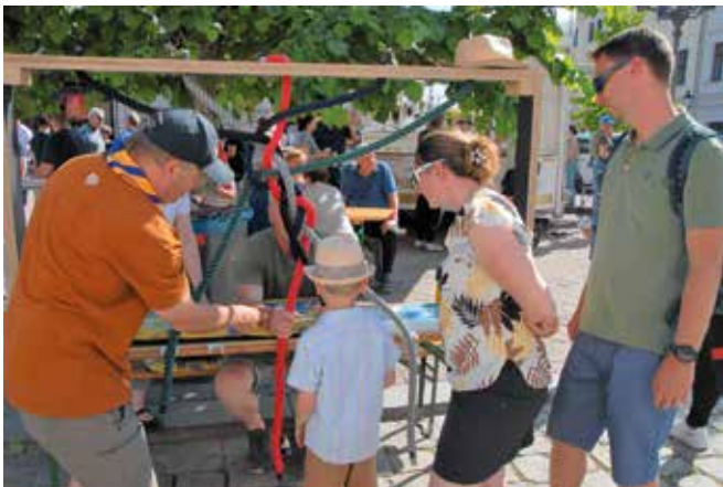
Bei den Royal Rangers in Großenhain, einer internationalen und überkonfessionellen christlichen Pfadfinderschaft, werden schon Kinder ab 3 Jahren zu Entdeckern.

Wussten Sie, dass es in Großenhain und den Ortsteilen über 130 Vereine verschiedenster Sparten und mit unterschiedlichsten Angeboten gibt? Dazu gehören etwa die Kinder-, Jugend- und Seniorenarbeit, Sport- und Kulturangebote, Umwelt-, Natur- und Tierschutz, der soziale Bereich, das Gemeinwesen sowie die Brauchtums- und Traditionspflege. Diese Vereine und Interessengemeinschaften ermöglichen nicht nur abwechslungsreiche Freizeitangebote für jedes Interesse und Alter, sondern leisten mit ihren Mitgliedern und Ehrenamtlichen auch einen unverzichtbaren Beitrag für eine lebendige und lebenswerte Stadt.