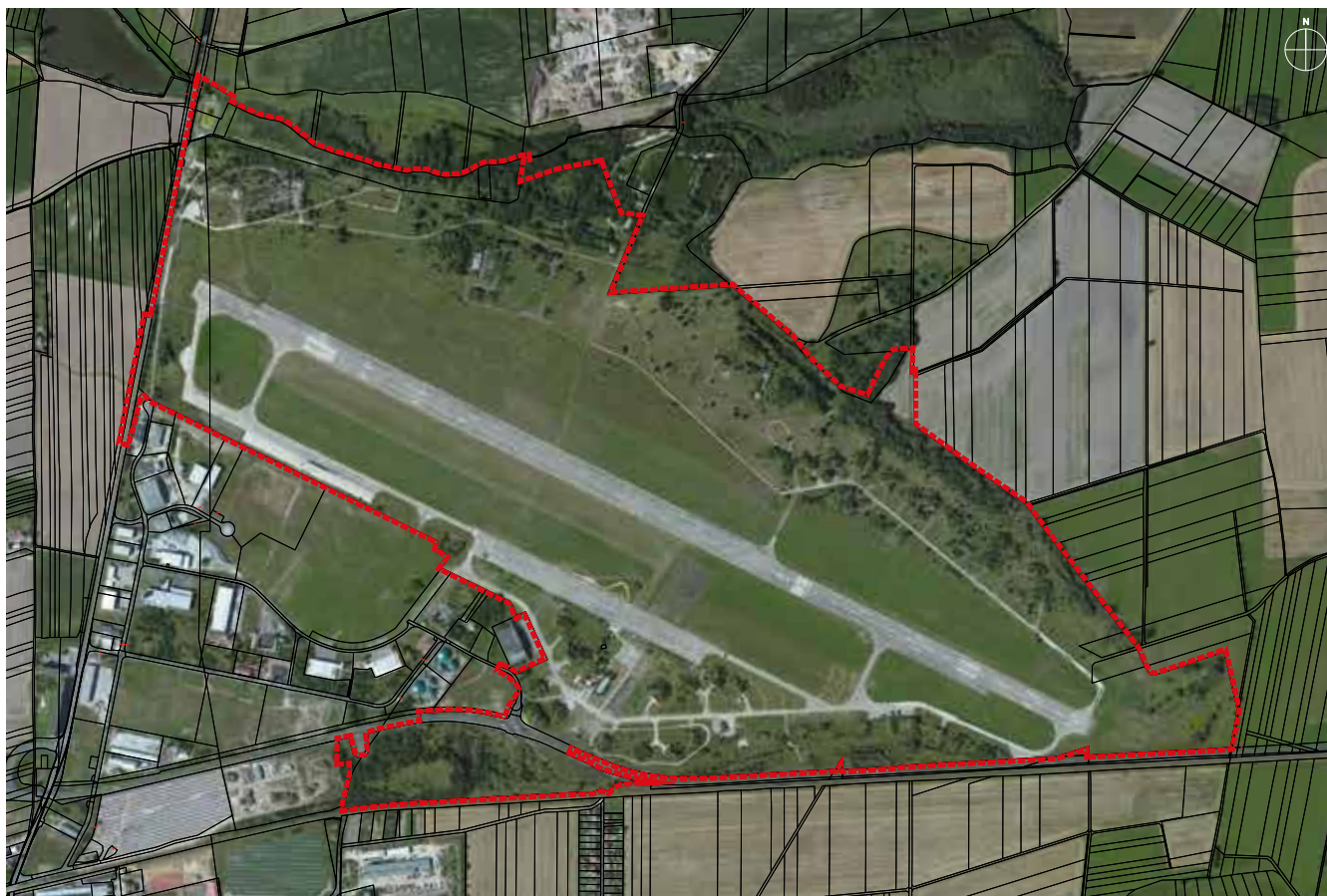
Übersichtsplan zum räumlichen Geltungsbereich des Bebauungsplanes "Industriegebiet Großenhain Nord"

Der Bebauungsplan "Industriegebiet Großenhain Nord" tritt gemäß § 10 Abs. 3 BauGB mit dieser öffentlichen Bekanntmachung in Kraft.