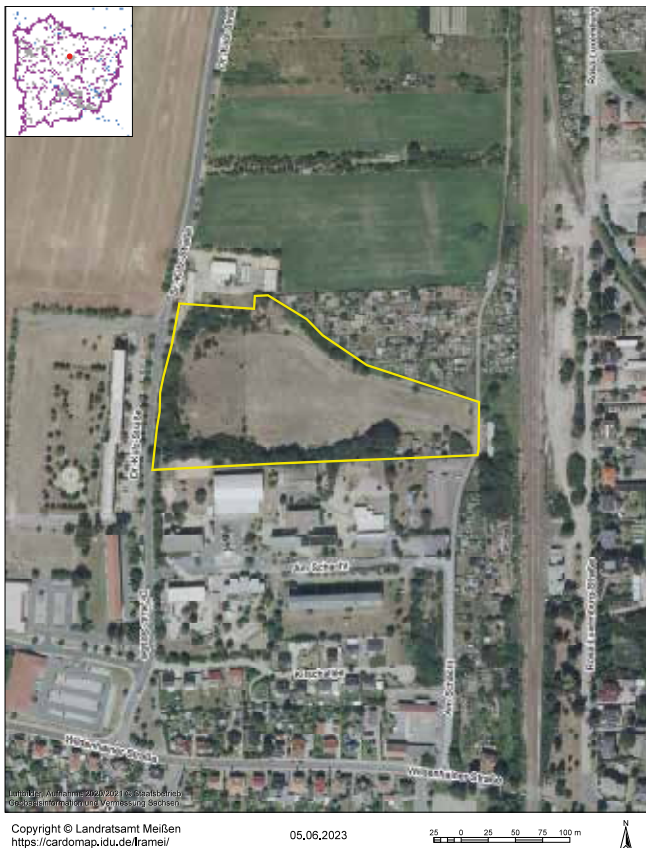
Grafik: Geoportal des Landkreises Meißen

Seit 2012 gibt es in Großenhain einen Hundefreilaufplatz. Dieser befindet sich nahe der Straße „Am Schacht“ im westlichen Stadtgebiet von Großenhain (Lageplan). Auf diesem frei zugänglichen Platz können Vierbeiner ohne Leine nach Lust und Laune mit ihren Frauchen und Herrchen flitzen und toben. Hier finden sich außerdem hundefreundliche Sportgeräte (Foto).