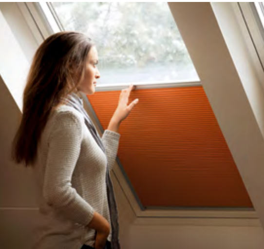
Wabenplissees halten dank ihrer Luftkammern die Wärme besonders gut im Raum.

Das Potenzial zum Energiesparen mit Sonnenschutz ist größer, als viele denken. Die Europäische Sonnenschutz-Organisation ES-SO bezieht die möglichen Energieeinsparungen und