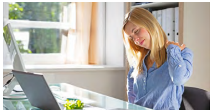
Wenn Freiberufler berufsunfähig werden, sollten sie gut abgesichert sein.

Anmerkung: Die auf dieser Seite behandelten redaktionellen Themen stellen keine rechtlich verbindliche Beratung durch den Verlag dar. Diese erhalten Sie ausschließlich bei Rechtsanwälten, Notaren, Versicherungsberatern, Steuerberatern, Lohnsteuerhilfen und dgl.