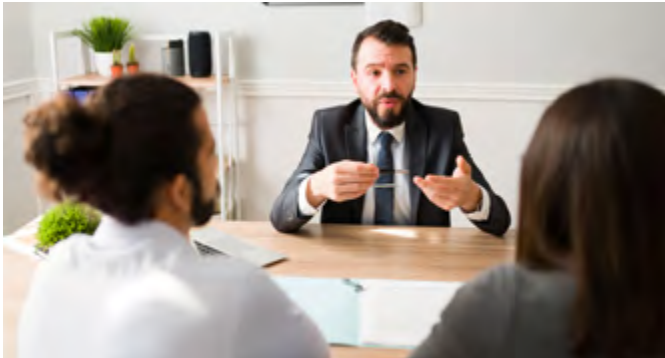
Freiberufler wie etwa Rechtsanwälte sind für den Fall der Berufsunfähigkeit häufig nicht ausreichend abgesichert.

Die Absicherung über das berufsständische Versorgungswerk ist meist unzureichend