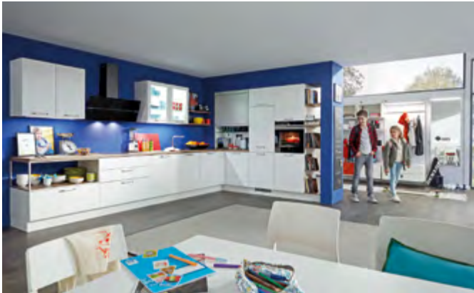
Die vielfältigen Module der Küchenhersteller erlauben eine individuelle und flexible Planung des ganzheitlichen Wohnens.

Von Küche bis Bad: Küchenhersteller bieten Lösungen für alle Räumlichkeiten