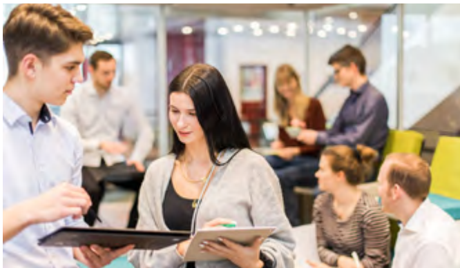
Welcher Beruf könnte mir Spaß machen? Für welche Tätigkeiten bin ich überhaupt geeignet? Naht das Ende der Schulzeit, machen sich viele junge Menschen Gedanken über ihre berufliche Zukunft.