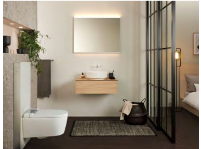
Sanitärmodule, unter deren eleganter Hülle sich die Spültechnik für die Toilette verbirgt, bieten eine einfache Lösung, den WC-Bereich attraktiv zu gestalten und sichtbar aufzuwerten.

Wenn bereits ein Unterputz-Spülkasten im Bad eingebaut ist, lassen sich mit dem Tausch der Betätigungsplatte für die Spülauslösung im Handumdrehen neue Akzente setzen. Die Be-