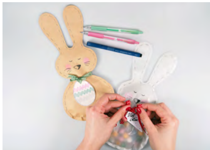
Niedliche Osterhasentüten machen die Eiersuche noch spannender und abwechslungsreicher.