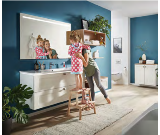
Schön, wenn auch die Badezimmereinrichtung zu den anderen Möbeln im Haus passt.

Immer mehr Küchenmöbelproduzenten haben mittlerweile stilvolle Lösungen für alle Räumlichkeiten im Portfolio. Das bietet viele Vorteile. „Beim Gang ins Küchenstudio können Kunden und Kundinnen nicht nur ihre Traumküche planen, sondern auch direkt weitere Wohnbereiche. Sie benötigen also nur eine Anlaufstelle, was viel Zeit spart und die Planung angenehmer macht“, erklärt beispielsweise Marko Steinmeier von KüchenTreff, einer Einkaufsgemeinschaft von mehr als 500 Küchenstudios und Fachmärkten in Europa. Unter www.kuechentreff.de/home-by-kuechentreff finden Interessierte Inspirationen für ganzheitliche Wohnkonzepte und können nach einem Küchenstudio in Wohnortnähe suchen. Vor allem aber schmeichelt eine sorgfältig aufeinander abgestimmte Einrichtung dem Auge und sorgt für Wohlfühlflair. Durch wiederkehrende Materialien, Formen und Farben ergibt sich ein schlüssiger Gesamteindruck.