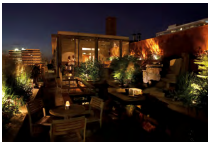
FXL LED-Leuchten von Rainpro kreieren ein rundum stimmiges Wohlfühlflair auf der Terrasse.

Licht hat entscheidenden Einfluss auf die Psyche und ein angenehmes Wohlfühlambiente. Insbesondere im Außenbereich setzt ein durchdachtes Beleuchtungsmanagement bestimmte Areale, Pflanzengruppen oder Deko-Elemente effektiv in Szene. Rainpro bietet hierfür mit dem 12 V starken FXL Luminare und dem LUXOR Lichtsteuerungssystem eine Lösung, die gleich drei Features zu einem überzeugenden Gesamtpaket kombiniert: Die Beleuchtung kann nicht nur in Farbe und Helligkeit flexibel der Stimmung und dem Anlass angepasst werden, sondern es lassen sich für verschiedene Bereiche auch unterschiedliche Szenarien (vor)programmieren. Die Steuerung von Zoneneinteilung, Dimmen und Lichtfarbe erfolgt komfortabel via Smartphone oder Tablet. Über die Zoneneinteilung werden verschiedene Leuchten zu Gruppen zusammengefasst, z. B. für die Terrasse, die Zufahrt oder den Gartenteich. So können etwa Einfahrten und Wege bereits mit Einsetzen der Dämmerung beleuchtet werden, um Bewohnern und Besuchern eine sichere Fortbewegung und gute Orientierung zu bieten, während andere Gruppen wie die Poolbeleuchtung erst in den Abendstunden aktiviert werden. Der Helligkeitsgrad wird über die Dimmfunktion reguliert. Für kunterbunte Vielfalt sorgen die passenden FXL LED-Leuchten, welche die Farben Rot, Grün, Blau und Weiß miteinander mischen und dadurch ein Spektrum von bis zu 30.000 Lichtfarben ermöglichen. Egal ob sommerliche Gartenparty, romantisches Candle-Light-Dinner unter Sternen oder jah-