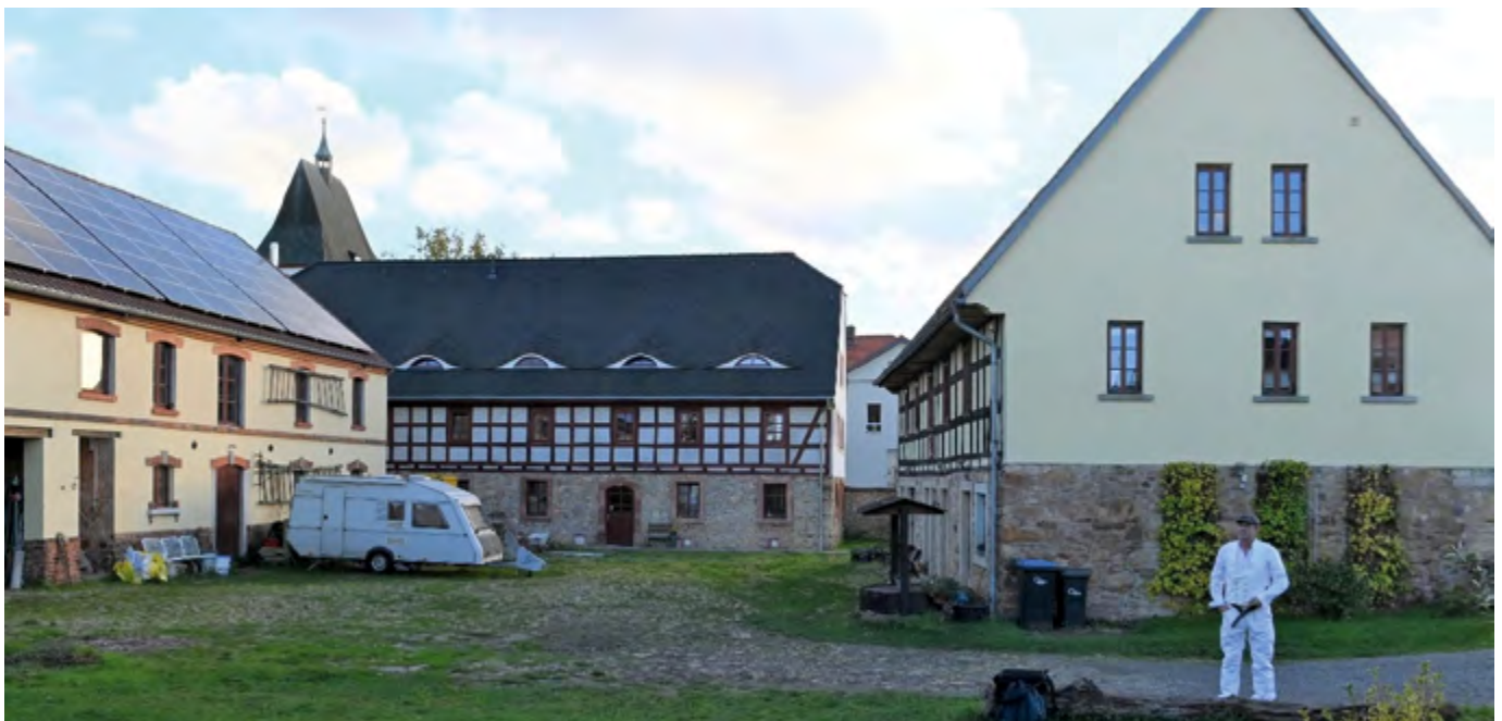
Der Hof in Eula im November 2022