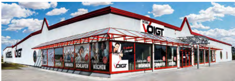
Der aktuelle Firmenstandort im Gewerbegebiet Eula

Seit nunmehr 115 Jahren ist das Familienunternehmen die erste Adresse, wenn es um Möbel und Küchen für die Leipziger und das Leipziger Umland geht.