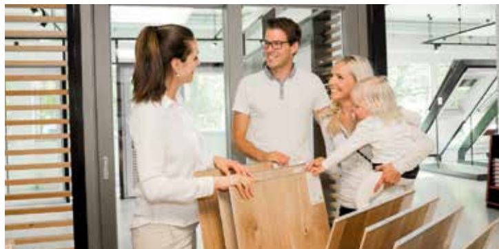
Wand- und Bodenbeläge