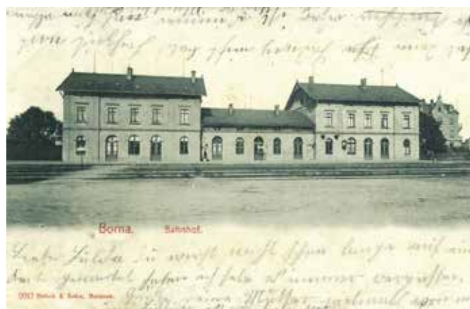
Alter Bahnhof Borna; Ansichtskarte, 1901