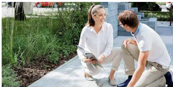
Garten, Terrasse und Zufahrt