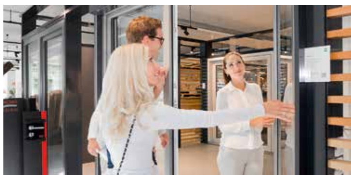
Fenster, Türen und Tore