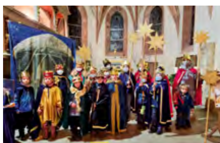
Aktuell Sternsingeraktion im zweiten Corona-Jahr erbrachte 6.945,13 Euro