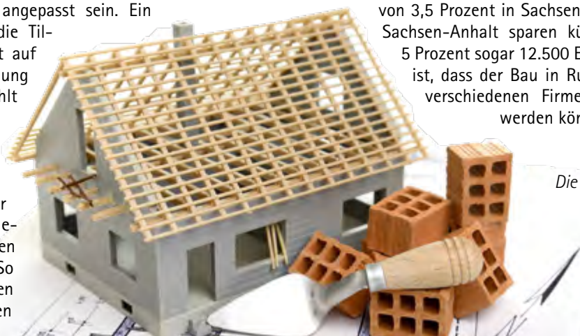
Dr. Klein Die Partner für Ihre Finanzen

In vielen Gemeinden ist Bauland rar. Entsprechend hoch sind die Preise für Grundstücke. Aber: Wer ein Grundstück ohne Haus kauft, kann zumindest bei der Grunderwerbsteuer sparen. Das kann gelingen, wenn der Grundstückskauf und der Bauvertrag keine Einheit bilden. Ein Beispiel verdeutlicht das Sparpotenzial: Werden bei einem Grundstückspreis von 120.000 Euro und Hausbaukosten von 250.000 Euro getrennte Verträge geschlossen, zahlen Bauherren, bei einem Steuersatz von 3,5 Prozent in Sachsen 8.750 Euro weniger. In Sachsen-Anhalt sparen künftige Eigentümer bei 5 Prozent sogar 12.500 Euro. Ein weiterer Vorteil ist, dass der Bau in Ruhe planbar ist und bei verschiedenen Firmen Angebote eingeholt werden können.