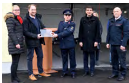
Aus der Stadtverwaltung Anfang Februar wurde das neue Feuerwehrgerätehaus übergeben