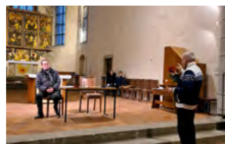
Veranstaltung Theatergruppe „Neue Wasser e.V.“ probt in der Stadtkirche neues Lutherstück