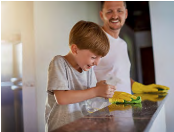
Mit den passenden Tricks und Hausmitteln wird alles hygienisch sauber. Dabei lässt sich obendrein so mancher Euro sparen.