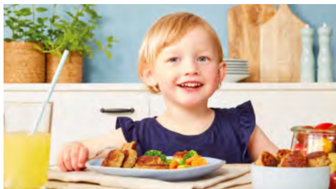
Wenn Kinder bei der Zubereitung helfen, schmeckt das Essen im Anschluss gleich viel besser.

Bei vielen Obst- und Gemüsesorten ist es eine Frage der Gewohnheit und des Angebotes, ob Kinder sie essen. „Die Vorbildfunktion der Eltern spielt hier eine große Rolle“, mahnt von Cramm an. „Darüber hinaus sollte man mit seinem Kind reden