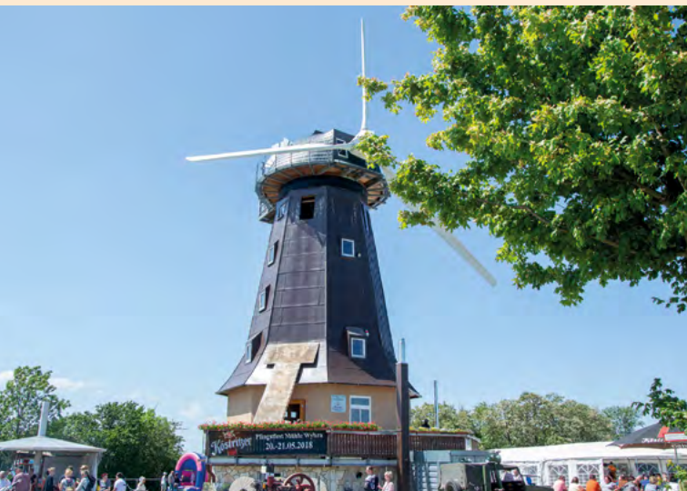
Archivbild: Mühlentag 2018

Der Mühlentag findet in diesem Jahr deutschlandweit am 12. September zum Tag des Technischen Denkmals statt. Ab 10.00 Uhr gibt es an diesem Tag an der Neuholländermühle in Wyhra durchgängig Kaffee, Kuchen, Eis und Herzhaftes. Ebenso ist die Besichtigung der Mühle mit Mühlenfilm am 12. September jederzeit möglich. Um 11.00 Uhr eröffnet die Ausstellung: Mühlen im Wyhratal .