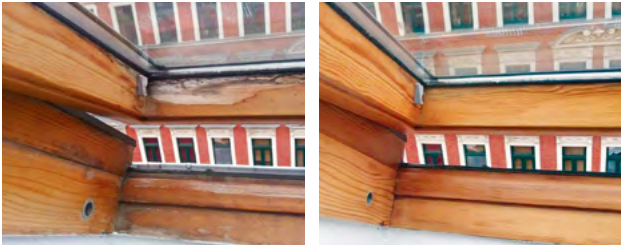
Vor und nach der Sanierung eines Dachflächenfensters

In die Jahre gekommene Dachflächenfenster sanieren? Die Firma FeWa 39 hilft!