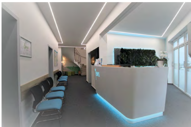
Die neu gestalteten Räumlichkeiten der BWS-Geschäftsstelle in der Roßmarktschen Straße

Nachdem es letztes Jahr pandemiebedingt ausfallen musste, kehrt das Eventshopping am 10. September in Bornas Innenstadt zurück. Wie in den Vorjahren gestalten die Firmen in der Innenstadt zusammen mit weiteren Gewerbevereinsmitgliedern eine Shoppingnacht der besonderen Art.