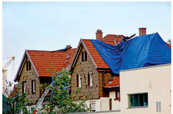
In der Grunddeckung bieten die meisten Wohngebäudeversicherungen Schutz gegen Naturgefahren wie Sturm und Hagel.

Die Stiftung Warentest („Mein test.de“, Ausgabe 3-2021“) hat insgesamt 178 Wohngebäudeversicherungen von 70 Anbietern unter die Lupe genommen. Der Vergleich zeigt: Es gibt große Unterschiede in puncto Preis und Leistung – und oft gefährliche Lücken. Nach Ansicht der Verbraucherschützer lohnt sich oftmals ein Wechsel der Versicherung. Denn ältere Verträge seien häufig unzureichend. Von den geprüften 178 Tarifen wurden insgesamt 79 als mangelhaft bewertet. Alle Tarife der Nürnberger Versicherung erhielten dagegen das Qualitätsurteil sehr gut mit der Gesamtnote 1,1. Unter www.nuernberger.de gibt es weitere Infos. Die Tarife erstatten je nach Ausgestaltung den vollen Kostenumfang für Reparatur oder Wiederaufbau des Hauses in gleicher Art und Güte.