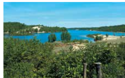
Blick über den Bockwitzer See

Wenn Sie mit dem Fahrrad über den Kreisverkehr Richtung Dittmannsdorf nach Eula düsen, ist der Weg zum Hainer See auch nicht mehr weit. Mit knapp 600 ha zählt dieser zu den Großen im Leipziger Neuseenland. Neben der Erholung bietet der Hainer See auch vielfältige Wassersportmöglichkeiten. Zudem ist er reizvoll eingebettet in eine natürliche und grüne Umgebung. Das Alleinstellungsmerkmal des Sees ist die Lagune