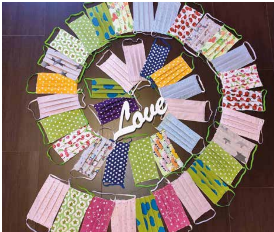
Pflege in Corona Zeiten – Eine besondere Herausforderung