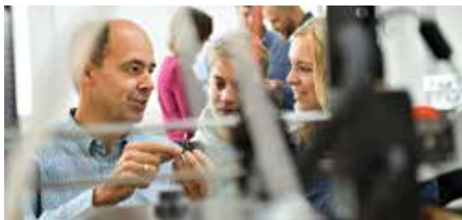
Ein berufsbegleitendes Studium bringt IT-Fachkräfte weiter.

Berufsbegleitender Bachelorstudiengang erhöht Karrierechancen