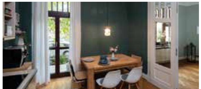
Ein besonderer Farbton für die Küche: Das trendige Waldgrün sorgt für eine gemütliche Stimmung.