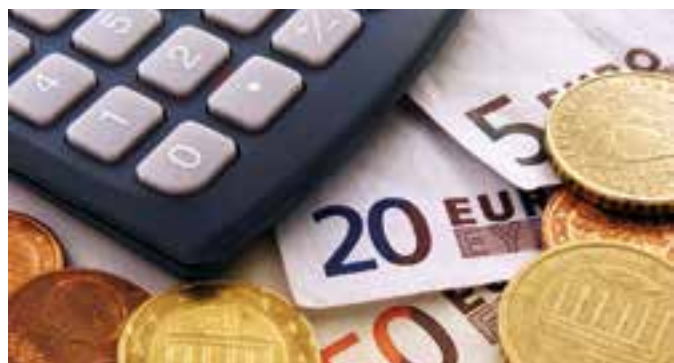
Ein ehrlicher Kassensturz muss am Anfang jeder Immobilienfinanzierung stehen.