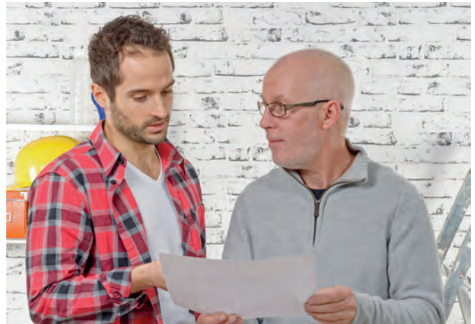
Betriebsräte sind das Sprachrohr der Belegschaft gegenüber der Unternehmensleitung.