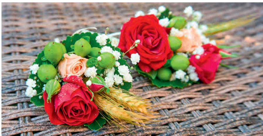
Anstecker für Bräutigam und Trauzeugen