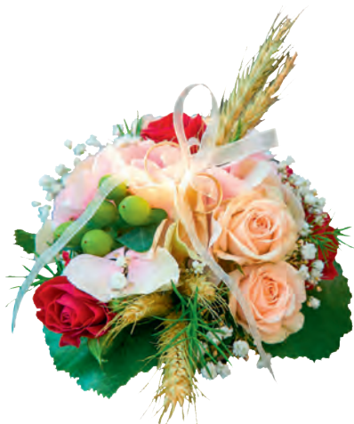
Ringkissen für Standesamt, Kirche oder freie Trauung