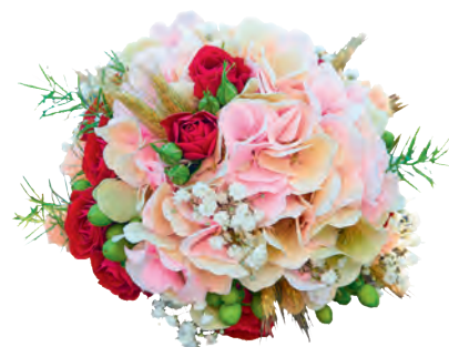
Brautstrauß in Kugelform

Gern beraten wir Sie ausführlich über die vielfältigen, floristischen Möglichkeiten für Ihren Tag und halten unseren praktischen Hochzeitsplaner für Sie bereit. Am Tag der Trauung liefern und dekorieren wir Ihren floralen Hochzeitsschmuck gern in Standesamt, Kirche, Restaurant, Schloss oder wohin immer Sie wollen! Wer sich traut, kommt zu uns: ins Hochzeits-Floristikfachgeschäft Raumzauber-Sinnwelt in Naunhof und Leipzig / Engelsdorf.