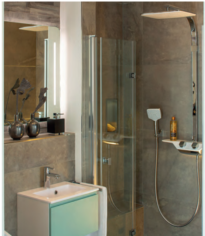
Kleines Bad, großes Wow: Faltpendeltüren und ebenerdige Walk-in-Duschen sind optimal bei wenig Platz.

Ins kleine Bad ziehen immer häufiger großformatige Fliesen ein. Im Trend sind XXL-Fliesen in Formaten von 60 mal 60 bis hin zu einer Länge von 120 Zentimetern. Für Wand und Boden kommen dabei die gleichen Fliesenprodukte zum Einsatz. Janssen: „Die Tendenz geht aber auch dahin, das Bad komplett fugenlos zu gestalten. Dabei bearbeiten wir die Wände mit einer Spachteltechnik. Das sieht nicht nur absolut stylish und hochwertig