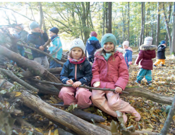
Auch bei kühleren Temperaturen kann man im Wald eine Menge entdecken und Spaß haben.