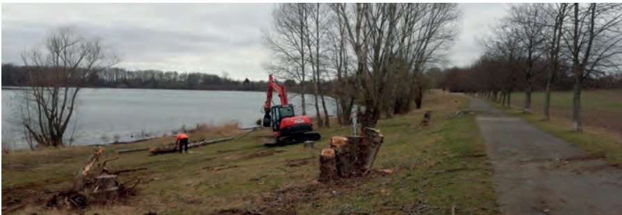
Weil sie krank sind und drohen, umzustürzen, müssen u.a. Bäume am Autobahnsee entfernt werden.