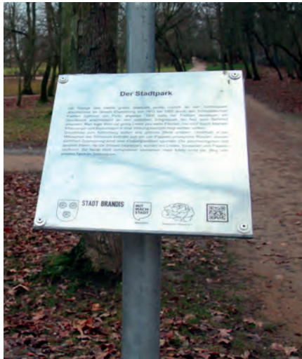
Ein Standort der Tafeln des Geschichtspfades befindet sich am Stadtpark, Eingang Bahnhofstraße.