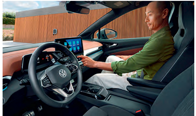
Erleben Sie den großen und intelligent gestalteten Innenraum, der Ihnen gehobenen Komfort bietet, den Sie sehen und spüren.

Der ID.5 ist das erste E-SUV-Coupé von Volkswagen. Der neue ID.5 und der sportliche ID.5 GTX mit Dualmotor Allradantrieb begeistern mit expressivem Design, Langstreckentauglichkeit und der neuesten Softwaregeneration. Der neue ID.5 beeindruckt mit einer zukunftsweisenden Form, die die Stärken eines SUV mit der aerodynamischen Silhouette eines Coupé vereint – ganz ohne Kompromisse. Erleben Sie gehobenen Komfort im großen und intelligent gestalteten Innenraum. IQ. Light. Panoramaglasdach. Anhängervorrichtung. Ambientebeleuchtung. AR-Head-up-Display. Mit kraftvoller E-Performance und einer fließenden Silhouette schafft der neue ID.5 eine moderne Symbiose aus SUV und Coupé. „Over-the-Air“ updatefähig und bereit, elektrische Mobilität neu zu definieren.