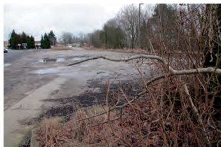
Im Moment bietet der Platz neben dem ehemaligen Bahnhofsgelände einen trostlosen Anblick. Bürgerinnen und Bürger sind gefragt, Ideen für eine Gestaltung einzureichen.