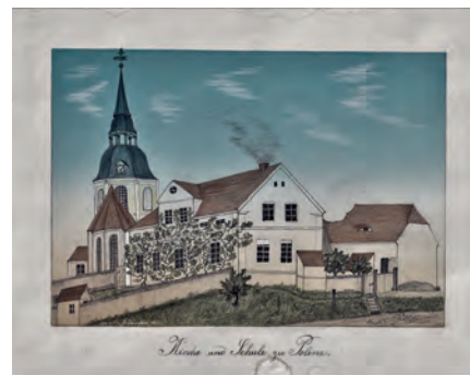
Diese Zeichnung wurde an die Brandiser Stadtverwaltung geschickt.

Ein Polenzer Pfarrer schreibt, dass der Schulmeister 1843/44 im Schulholz einen Münzfund machte, dessen beachtlichen Erlös man zum Schulbau verwendete. Vom weiteren Schicksal Zehrfelds be-