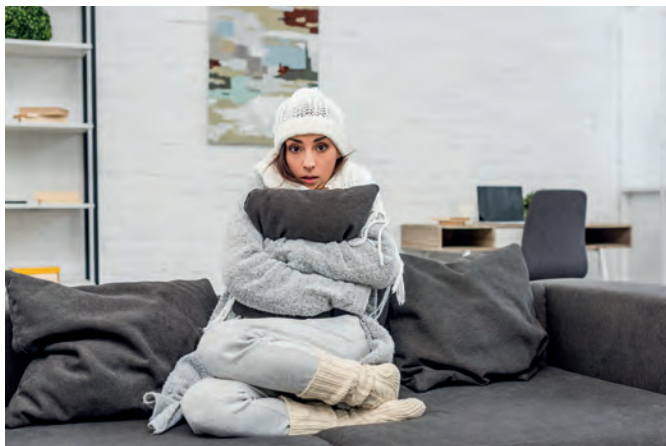
Wenn die Heizung bei winterlichen Minusgraden ausfällt, kann die schnelle Notfallhilfe durch den Handwerker richtig ins Geld gehen.