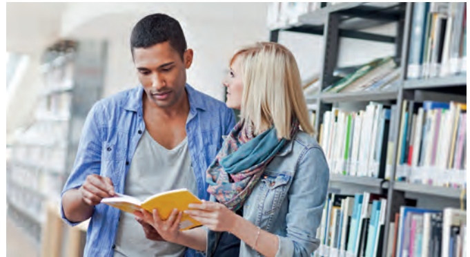
Organisationstalent und kommunikative Stärken sind für typische Tätigkeiten bei Berufsgenossenschaften gefragt.

Duales Studium oder Berufsausbildung: Fachkräfte aus verschiedensten Bereichen finden bei der Berufsgenossenschaft ein abwechslungsreiches Arbeitsfeld vor. Organisationsschick ist dabei genauso gefragt wie