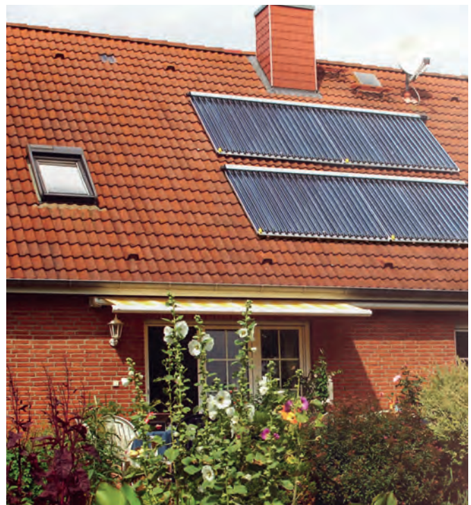
Sonnenwärme ist kostenfrei, umweltschonend, krisensicher und ihre Nutzung wird vom Staat finanziell stark gefördert. Kein Wunder also, dass immer mehr Eigenheimbesitzer ihre Heizung durch ein solarthermisches System auf dem Dach unterstützen.

Alternative Heizformen wie das Heizen mit Sonnenenergie oder Holzpellets haben hier eindeutig die Nase vorn. Denn Sonnenwärme ist nicht nur CO 2 -emissionsfrei, sondern obendrein unbegrenzt verfügbar, autark und krisensicher. Auch Holzpellets gelten als klimaneutraler Brennstoff, denn beim Verbrennen der kleinen Holzpresslinge wird nur so viel CO 2 freigesetzt, wie der Baum beim Wachsen gebunden hat. Zudem sind Pellets ein nachwachsender, regionaler Energieträger. Wer als Hausbesitzer zum Klimaschützer wird, kann mit kräftiger finanzieller Unterstützung durch den Staat rechnen – bis zu 55 Prozent der Investitionskosten für ein Heizsystem auf Basis regenerativer Energien werden erstattet. Weitere Infos rund um Solarthermie und Pelletheizungen gibt es online unter www.paradigma.de