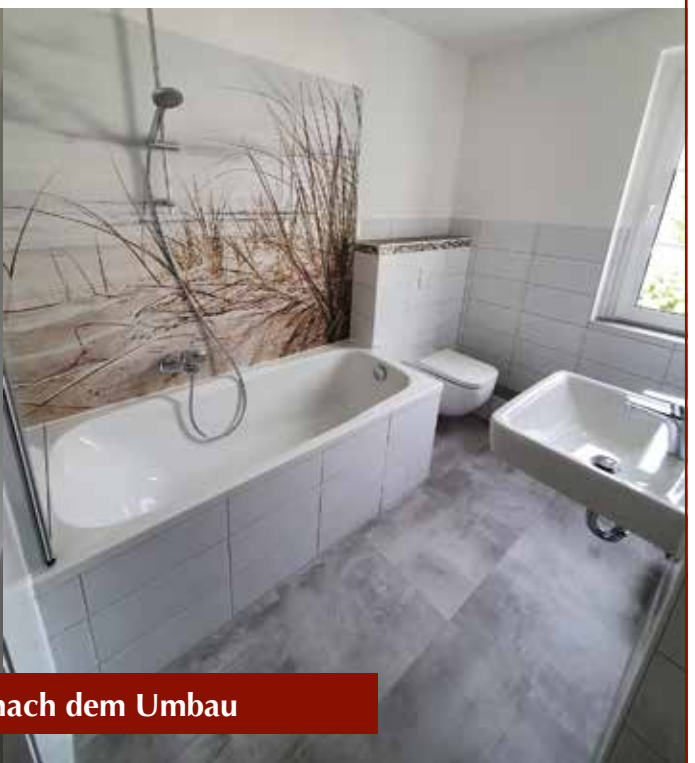
Küche und Bad nach dem Umbau