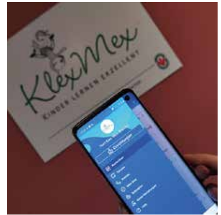
Die Kinder freuten sich über die vom Elternrat gesponserte Eisrunde bei Lilly Vanilly. Die Krippenkinder erhielten bunte Eisteller.

Wir freuen uns sehr, dass neben der Kita „Zum Knirpsentreff“, die bereits seit April 2020 mit der Kita-Info-App gute Erfahrung