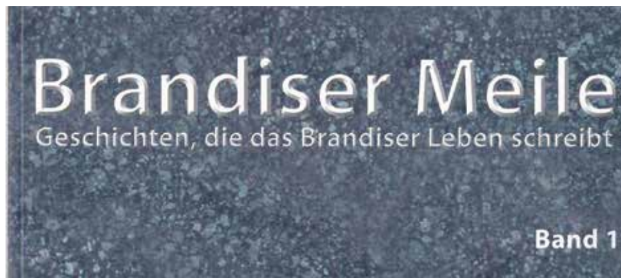
Band 1 des Meilenheftes – im September wird Band 2 erscheinen.