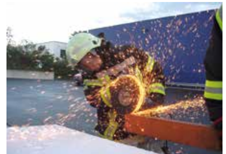
Das Trennen von unterschiedlichen Werkstoffen wurde bei der Ausbildung geübt.

Desweiteren übten wir das Trennen von unterschiedlichen Werkstoffen mit speziellen Trennschleifern und der Säbelsäge. Ein