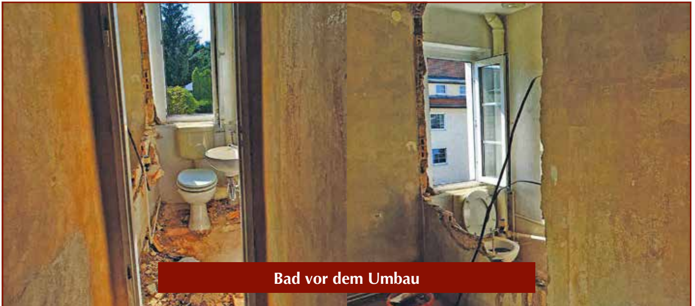
Bad vor dem Umbau