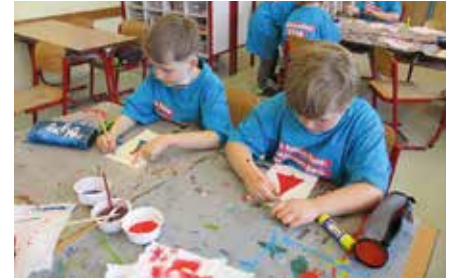
Beim Basteln für den Vatertag.

Damit konnten wir sie ganz in Ruhe betrachten, ihr Aussehen vergleichen und er-