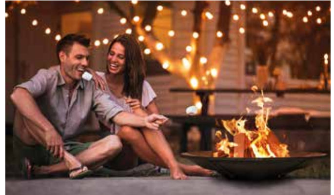
Massive Feuerschalen aus Gusseisen stehen für Qualität und Langlebigkeit.

Sei es für das pure Ambiente oder die wohlige Wärme an lauen Abenden – ein Holzfeuer unter freiem Himmel verzaubert jeden. Wer es praktisch und flexibel mag, greift am besten zu einer Feuerschale. Ganz nach Bedarf kann sie überall im Garten aufgestellt werden. So passt sich das flammende Vergnügen den eigenen Wünschen an und bleibt dauerhaft mobil. Der Feuerungsspezialist Leda gibt ein paar Tipps, worauf es beim Kauf ankommt.