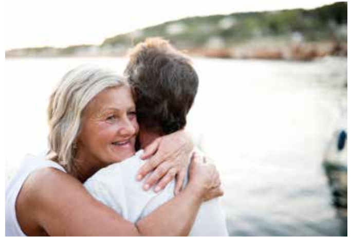
Schlaganfall vermeiden: Ist das PFO die Ursache für einen Schlaganfall, kann diese Öffnung zwischen den Vorhöfen durch einen Eingriff verschlossen werden.

Bei etwa 25 Prozent der Menschen verschließt sie sich jedoch auch nach der Geburt nicht ganz. Durch das kleine Loch kann ein Blutgerinnsel, das sich etwa in der Becken- oder Beinvene gebildet