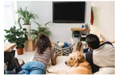
Das Effizienz-Label von TV-Geräten und Monitoren mit High Dynamic Range (HDR) zeigt zwei Verbräuche: Es weist den normalen Stromverbrauch und den Verbrauch bei HDR-Nutzung aus.

Abzuwarten bleibt, inwiefern der neue QR-Code einen Mehrwert für die Verbraucher schaffen kann. Mithilfe einer App können über den QR-Code verschiedene Geräte auf Basis der Effizienzklassen miteinander verglichen werden. Da es sich prinzipiell um größen- bzw. kapazitätsspezifische Effizienzklassen handelt, wäre eine Angabe von zu erwartenden jährlichen Betriebskosten wünschenswert. Diese Information ist für Verbraucher von großem Interesse, allerdings liefert auch das neue Label hierzu keine konkreten Informationen. akz-o