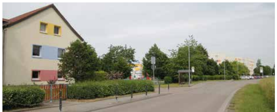
Aus dem Ensemble von Grundschule, Kindertagesstätte und Wohnblöcken soll innerhalb des Projektes Smart City das Zukunftsquartier Beucha entstehen.

Andererseits wird mit dem „Zukunftsquartier Beucha“ ein Projekt angegangen. Das Ensemble von Wohnblöcken, Kindergarten und Grundschule an der Kleinsteiberger Straße in Beucha wird als Schlüsselprojekt entwickelt. Die primäre Zielsetzung für dieses Projekt beinhaltet die stufenweise Realisierung von geeigneten Maßnahmen zur Schaffung eines eigenversorgten und klimaneutralen Quartiers. 🌸