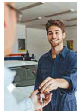
Nach einem kurzen Boxenstopp ist das Fahrzeug fit für frostige Tage und Nächte: Sommercheck und Einbau einer Standheizung sind in weniger als einem Tag erledigt.

Den Gewinn an Komfort und Sicherheit, den eine Standheizung mit sich bringt, werden Autofahrer schon nach der ersten Frostnacht nicht mehr missen wollen. Das nervige Kratzen entfällt komplett, stattdessen profitiert der Fahrer stets von einer freien Sicht - was gerade bei den wechselnden und anspruchsvollen Witterungsbedingungen meistens schon ab Oktober wichtig ist. Das Vorwärmen verhindert zudem, dass die Scheiben nach wenigen Metern bereits wieder von innen beschlagen. Standheizungen sind darüber hinaus sogar ganzjährig von Nutzen. Sie wärmen nicht nur das Auto an frostigen Tagen vor, sondern verfügen zusätzlich über eine Standlüftungsfunktion. Das verhindert, dass es im Sommer bei geparkten Fahrzeugen zum Hitzestau kommt. djd