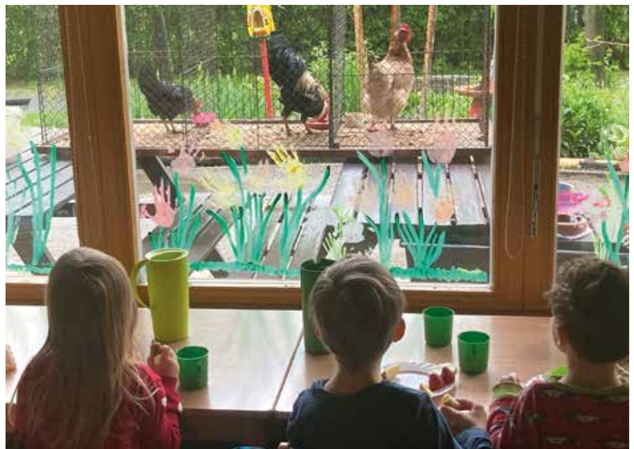
Zum Frühstück konnten die Kinder Hühner beobachten.

uns. Ganz einfach: anhand eines einen Meter großen, selbst gebauten Ohres, an dem die Einzelteile und der Weg des Hörens verfolgt werden konnten. Zum Thema Hören gab es außerdem ein tolles Dosentelefon. Auch das Riechen wurde praktisch behandelt. So waren beispielsweise echte Hühner zu Gast in der Kinderstube und durften auf ihre Nase untersucht werden. Zur Belohnung gab es sogar ein Ei. In der Waldgruppe wurde Lagerfeuer gemacht und Popcorn geröstet – einprägsame und anheimelnde Gerüche. Zum Thema Sehen waren unsere Kinder nach-