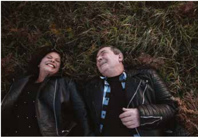
Menschen mit bestimmten Vorerkrankungen am Herzen wie einem PFO haben ein erhöhtes Risiko für einen Schlaganfall.

Für einen Schlaganfall ist häufig eine verschlossene Arterie der Auslöser. Jedoch kann die Ursache auch in einem PFO, einem persistierenden Foramen ovale, liegen. Diese angeborene Öffnung zwischen den beiden Vorhöfen des Herzens hat jeder menschliche Embryo.