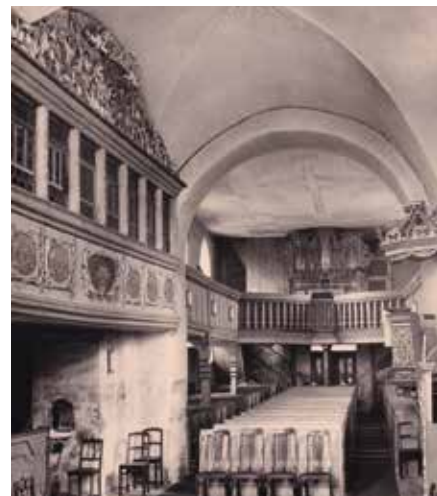
Kirche im Inneren bis 1967