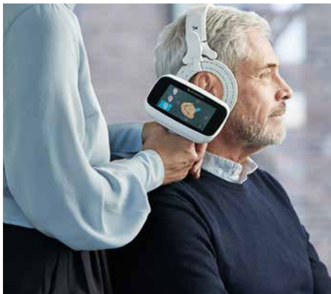
Bildtext: Das Handwerk nutzt modernste Technologien – hier erfolgt die Ohrabformung mit 3-D-Scanner, statt das äußere Ohr mit Silikon abzuformen.

Durch die Arbeit am Kunden ergeben sich für Hörakustiker täglich Erfolgslebnisse, wenn sie mit viel Einfühlungsvermögen und Beratungskompetenz zu optimalen Hörlösungen