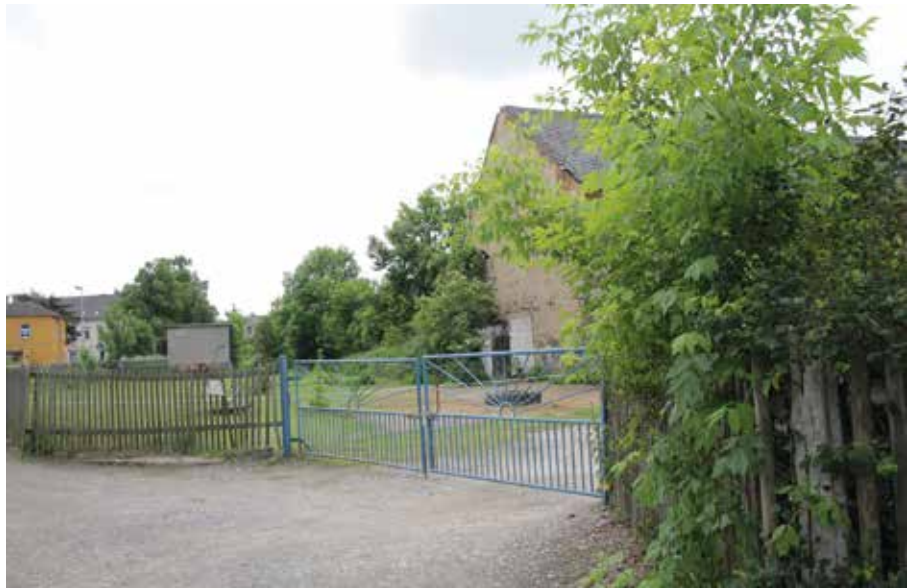
Die Einfahrt in das neue Wohngebiet soll über die Würzener Straße angelegt werden.

Der denkmalgeschützte Dreiseithof soll erhalten und saniert werden. Und dessen Motiv werde als Grundlage für so genannte Hofhäuser verwendet. Auf dem insgesamt rund 2,4 Hektar große Areal sind fünf Baufenster mit insgesamt 60 Wohneinheiten vorgesehen – eine deutliche Reduzierung der vorher geplanten 90 Wohneinheiten. Die Bebauung an der Würzener Straße entlang wird lockerer, ein angedachtes, klassisches Mehrfamilienhaus wird es dort nicht geben. In zwei Baufenstern war zudem ein dreigeschossiges Gebäude angedacht. Auch