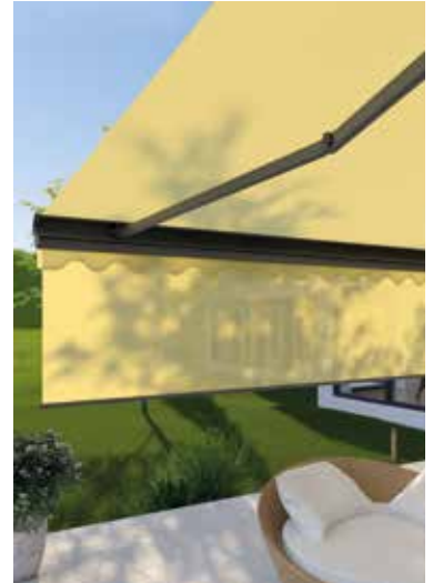
Mit einem guten Sonnenschutz macht das Surfen und Online-Kontakten auch draußen auf der Terrasse Spaß.

Wer sich gegen die Strahlen tief stehender Sonne, die besonders unangenehm blenden können, morgens oder am Abend schützen möchte, setzt zusätzlich senkrechte Verschattungen ein, die ähnlich wie Fenstermarkisen wirken. Geeignet sind Seitenmarkisen, die waagrecht ausgezogen werden, ausfahrbare Vario-Volants am vorderen Rand von Gelenkarmmarkisen oder Senkrechtmarkisen am Glasdach. djd