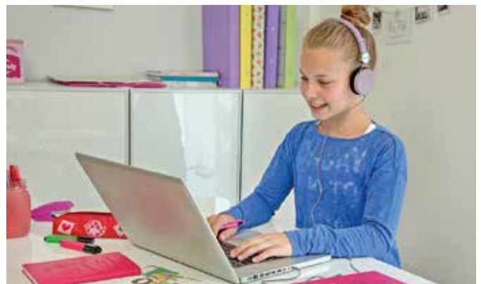
Mit zusätzlichen digitalen Lernangeboten können Schülerinnen und Schüler den Unterrichtsausfall an den Schulen etwas kompensieren.

Was macht die Coronakrise mit Schülerinnen und Schülern? Eine Forsa-Umfrage im Auftrag des Studienkreises ergab: Etwa ein Drittel der befragten Eltern nimmt in der Pandemie einen verschärften Druck auf ihre Kinder wahr. Zwei unabhängige Anbieter haben sich nun zusammengeschlossen, um den Schülern in dieser schwierigen Zeit gemeinsam Unterstützung zu bieten. Vor der Pandemie lag der Fokus des Instituts Studienkreis auf stationärer Nachhilfe in Kleingruppen vor Ort. Teilweise sind die Dozenten zu den Schulschließungen auf Online-Unterricht umgestiegen. Die Online-Lernplattform Sofatutor stellt dazu bewährte Lernvideos, Online-Übungen und digitale Arbeitsblätter kostenlos zur Verfügung. Unter www.studienkreis.de gibt es dazu mehr Informationen. djd