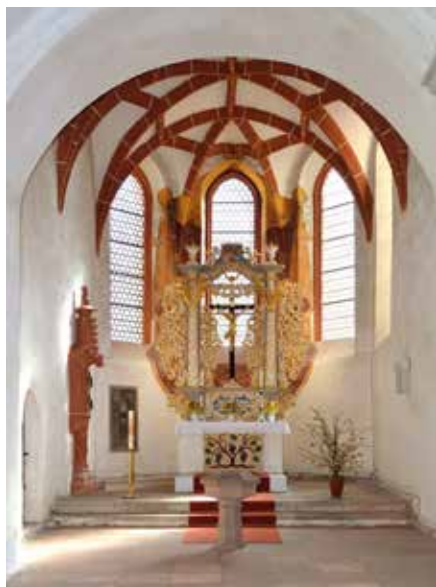
Altarraum in der Gestaltung bis 2020

Die Brandiser Kirche überrascht den Besucher mit einem großen und hellen Altarraum. Der geschnitzte Altaraufsatz mit in Weiß und Gold gehaltenem Rankwerk und Engelfiguren ist vielfach durchbrochen und lässt so das Licht hindurch. Am Fuß des Kreuzes ist ein Totenschädel sichtbar. Die barocken Schnitzkünstler sagen damit: Gott hat Christus auferweckt, den Tod besiegt und neues Leben geschaffen.