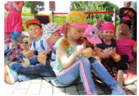
Die Kinder freuten sich über die vom Elternrat gesponserte Eisrunde bei Lilly Vanilly. Die Krippenkinder erhielten bunte Eisteller.

Für diesen gelungenen Tag danken wir allen Eltern für die Unterstützung sowie dem Elternrat, dem Eiscafé „Lilly Vanilly“,