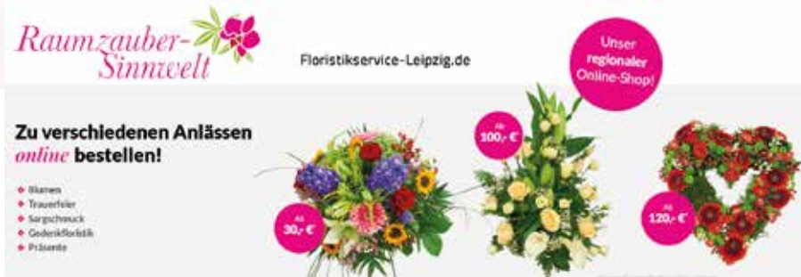
Rund um die Uhr einfach von zu Hause aus bestellen.