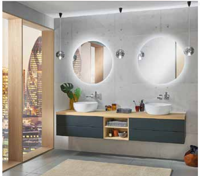
Per Facelift zum Traumbad: Sanipa hat seine modulare Badmöbelserie 2morrow um neue Farben, Oberflächen, Produkte und viele clevere Details ergänzt.

Mehr gibt es unter www.sanipa.de sowie www.homeplaza.de .