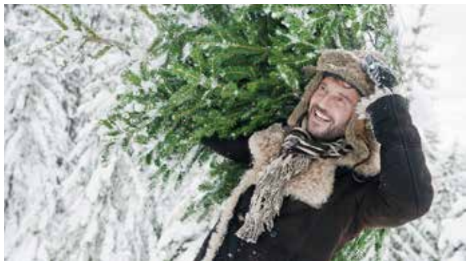
Umweltfreundlich: Am besten wählt man einen Baum aus ökologischem Anbau oder vom heimischen Förster vor Ort aus.

Weihnachten ressourcenschonender feiern? Mit etwas Umdenken kann das schon dieses Jahr klappen. Zum Beispiel, indem man einen Weihnachtsbaum mit FSC-Siegel aus der Region wählt. Das Siegel garantiert, dass der Baum aus einem Betrieb mit umwelt- und sozialverträglicher Waldwirtschaft stammt. Auch der Baumständer kann umweltfreundlich sein. Der Green Line M von Krinner etwa ist der weltweit erste Ständer aus recyceltem Plastikmüll. Er wird nachhaltig und ressourcenschonend in Niederbayern hergestellt. Wer Lichterketten und Co. benutzt, sollte zu energiesparenden LED-Varianten greifen und den Baum erst abends „leuchten“ lassen. Und warum nicht mal nett dekoriertes Recycling- und Packpapier für das Verpacken der Geschenke verwenden? djd