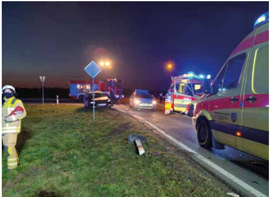
Im November mussten die Kameraden unter anderem wegen eines Verkehrsunfalls ausrücken.

Den größten Einsatz in diesem Jahr hatten wir am 5. Dezember zu absolvieren. In einem Einfamilienhaus befand sich das Erdgeschoss bei unserem Eintreffen bereits in Vollbrand. Zum Glück war das Haus mit Rauchmeldern ausgestattet, so dass der sich im Haus befindliche Bewohner selbst retten konnte, bevor wir da waren. Alle Brandiser Ortsfeuerwehren waren mit allen ihren Fahrzeugen und insgesamt 42 Einsatzkräften aktiv. Durch einen gezielten Innenangriff und Löscharbeiten von außen konnte die Flamme schnell gelöscht werden. Diese hatte sich jedoch bereits vorher in die Dachkonstruktion hineingefressen, so dass von