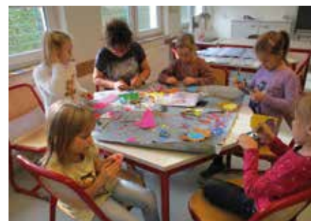
Gern wird in den warmen vier Wänden auch gebastelt.

Mehrzweckhalle Seile erklommen Spaß, Bewegung, Teamgeist spannende Spiele mit Pfiß austoben