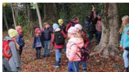
Herbstlicher Spaziergang für die Kinder der Brandiser Hortgruppen.

Fahrzeugparcours rasch, geschwind im Slalom gefahren mit lustigen Stationen gespickt Fahrzeuge