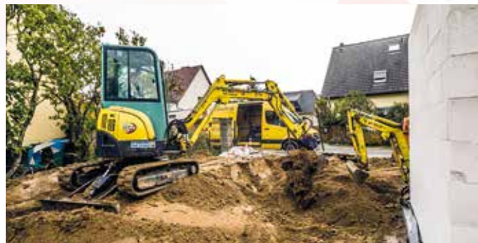
Gegen den Beginn eines Hausbaus noch im Winter spricht nichts, wenn der Bauunternehmer entsprechende Vorsichtsmaßnahmen trifft und Bauunterbrechungen etwa bei Frost einplant.

Für die Verarbeitung der meisten Baustoffe liegt die Temperaturgrenze bei fünf Grad, darunter lassen sie sich nicht mehr optimal verarbeiten und es drohen Schäden. Das gilt nicht nur für Beton, Zement und Mörtel, sondern auch für Farben, Lacke und andere Innenaus-