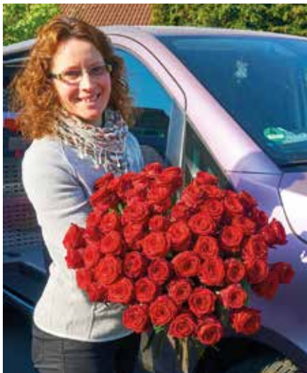
Wir liefern Ihren Blumengruß gern für Sie aus.