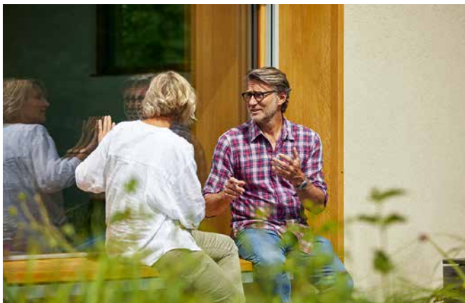
Reicht ein Anstrich oder sollte im selben Zuge auch gedämmt werden? Die Neugestaltung der Fassade ist eine Investition in die Wertsteigerung der Immobilie.

Tipps für die optische und energetische Modernisierung des Eigenheims