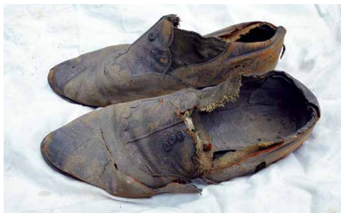
Wer die wohl getragen hat? Die Kirchgemeinde ist auf der Suche nach Infos dazu, aus welcher Zeit dieses bei den Sanierungsarbeiten gefundene Paar Schuhe stammt.