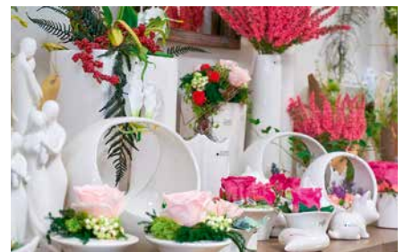
Das erfolgreiche Naunhofer Konzept – Blumenarrangements zu jedem Anlass, farbenfroh blühende Pflanzen für den Innen- und Außenbereich, köstliche Präsente und zauberhafte Dekorationen – hält nun auch in Leipzig/Engelsdorf Einzug.