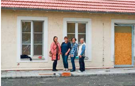
Wir freuen uns auf Sie in der Hugo-Aurig-Straße 7, direkt gegenüber dem ALDI Engelsdorf.

Die Freude der Engelsdorfer ist verständlich: endlich bereichert wieder ein Floristikgeschäft das Einzelhandelsangebot in Engelsdorf und Sommerfeld. Allerdings eröffnet mit dem Floristikfachgeschäft „Raumzauber-Sinnwelt“ nicht nur ein einfaches Blumenlädchen, sondern ein Fachgeschäft für niveauvolle, kreative Floristik kombiniert mit außergewöhnlichen Geschenkideen und stilvollen Dekorationen.