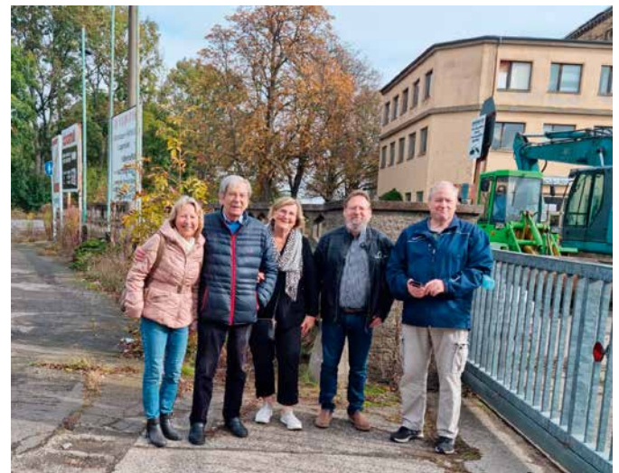
Vor der Ruine der Kunstlederfabrik