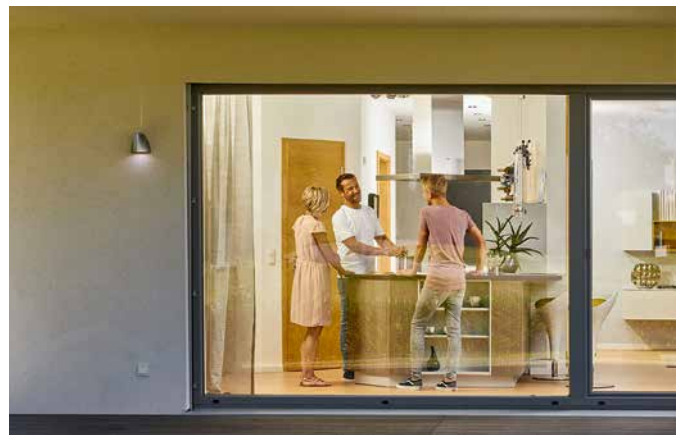
Wohlfühlen im Zuhause: Eine hochwertige Dämmung verbessert das Raumklima zu jeder Jahreszeit.

Der Zahn der Zeit nagt an jedem Eigenheim. Die Außenhülle eines Gebäudes ist allen Witterungsbedingungen ausgesetzt, früher oder später führt daher an einer Fassadensanierung kein Weg mehr vorbei. Für Hausbesitzer gilt es dabei, die unterschiedlichsten Ziele unter einen Hut zu bringen: optische Verschönerung, Wertsteigerung der Immobilie und nachhaltige Energieeinsparungen. Mit einer Wärmedämmung etwa, die staatlich gefördert wird, kann man einen persönlichen Beitrag zu mehr Klimaschutz leisten.