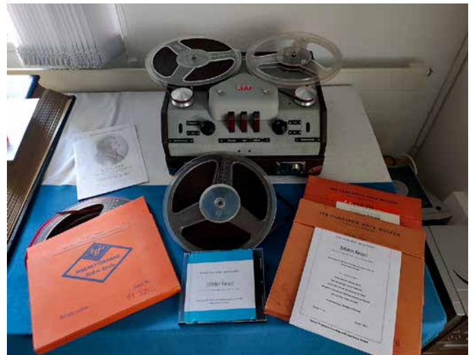
Altes Tonbandgerät BG 19-2 und Tonbänder

Nun kam der spannende Moment: Was werden wir zu hören bekommen? Obwohl die Aufnahmen knarnten und schnarnten, konnte man einzelne Titel erkennen. Diese galt es nun mit den im Museumsarchiv zahlreich vorhandenen Plakaten und Programmen des Männerchores Borsdorf abzugleichen. Viele Stunden Männerchorgesang in sehr schlechter Tonqualität waren nicht gerade eine Wohltat für die Ohren. Schließlich aber war es geschafft und die Konzerte mit den dazugehörigen Programmen gefunden. Per Vorstandsbeschluss wurden die Bänder zur Restaurierung und Digitalisierung an eine Spezialfirma gegeben,