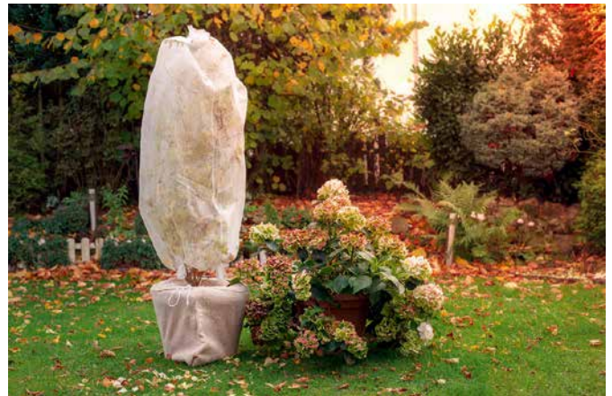
Jutesäcke schützen den Wurzelbereich der Pflanzen vor Frost. Die Vlieshaube lässt Licht und Luft durch.

Um empfindliche Rosensorten vor niedrigen Temperaturen und Frostrissen durch die Winter Sonne zu schützen, sollte die Triebbasis zum Beispiel mit Tannenreisig oder einer Mischung aus Mutterboden und Kompost abgedeckt werden. Für Kübelpflanzen gibt es wasser- und luftdurchlässige Vliesmägen, wie unter www.as-garten.de im Bereich Zubehör zu sehen ist.