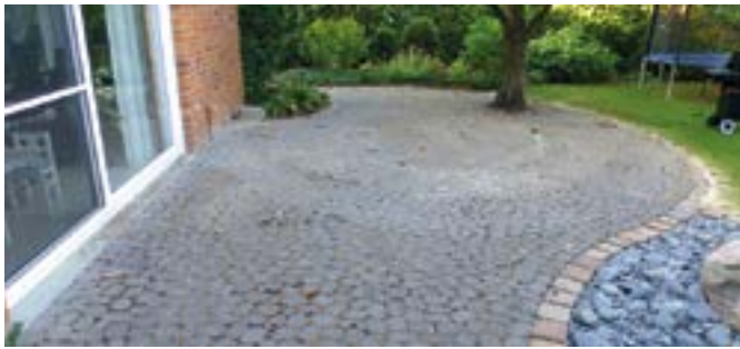
Vorher: Die Terrasse aus runden Pflastersteinen ist stark sanierungsbedürftig

Mit Steinfresh sind Pflastersteine dauerhaft gepflegt und geschützt