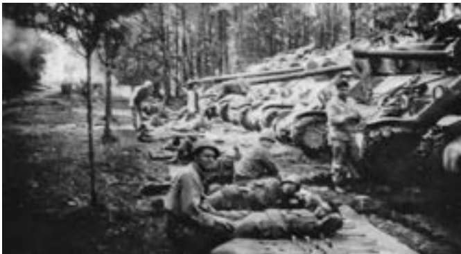
Soldaten des 77. Panzerbataillons in der verlängerten Parkstraße / Richtung Schwanenteich