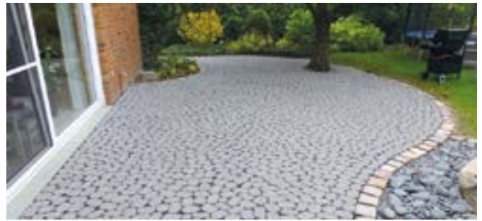
Nachher: Die perfekte Terrasse nach der Stein-Sanierung