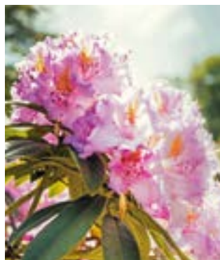
Für seine Blütenpracht ist der Park von Graal-Müritz bekannt.